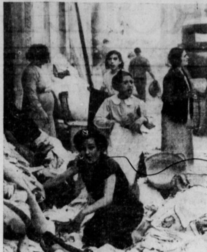
Fašistični letalci in njih vojne ladje so napravili Barceloni že veliko škodo in vzeli mnogo življenj. Na gornji sliki je skupina žensk, ki iščejo v svojih razbitih stanovanjih obleko in pohištvo, kolikor je še porabnega. Mnogo žensk in otrok je bilo ubitih. Moški so večinoma na fronti. V Španiji je zdaj v veljavi pregovor, da je na fronti varnejše, kakor pa v mestih.

gospod s palico, ki jo je imel v roki, oprezno, tako da gospa ni opazila mahniti po fantku, kakor da je konj. Fantek se je malone sesedel od bolečine. Zakaj palica je bila tenka in šibka in zamah je bil priličen.