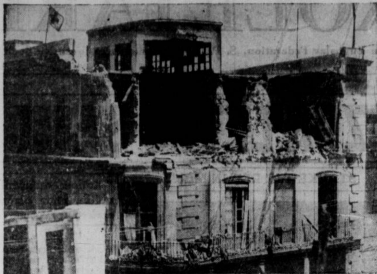
Bombe iz Hitlerjevih in Mussolinijevih aeroplanov so porušile v španskih mestih neiteto posolpji. Deset-tisoče ljudi, med njimi veliko žensk in otrok, je bilo v napadnih na španska mesta ubitih. Na sliki je bolnišnica v Almeriji, oziroma kar je po fašističnem napadu ostalo od nje.