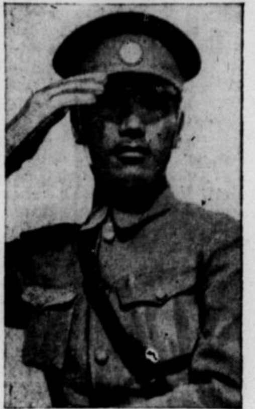
DIKTATOR CIANG KAI-SEK

ljivost kitajskih mej. Tudi ko je japonska udrla v Mandžurijo, je Kitajska apelirala, ampak dosegla ni ničesar. Liga narodov je takrat sicer poslala komisijo v Mandžurijo, ki je ugotovila, da so Japonci res napadali, ne pa Kitajci, zato je kršila pravila lige narodov Japonska. To bi komisija lahko