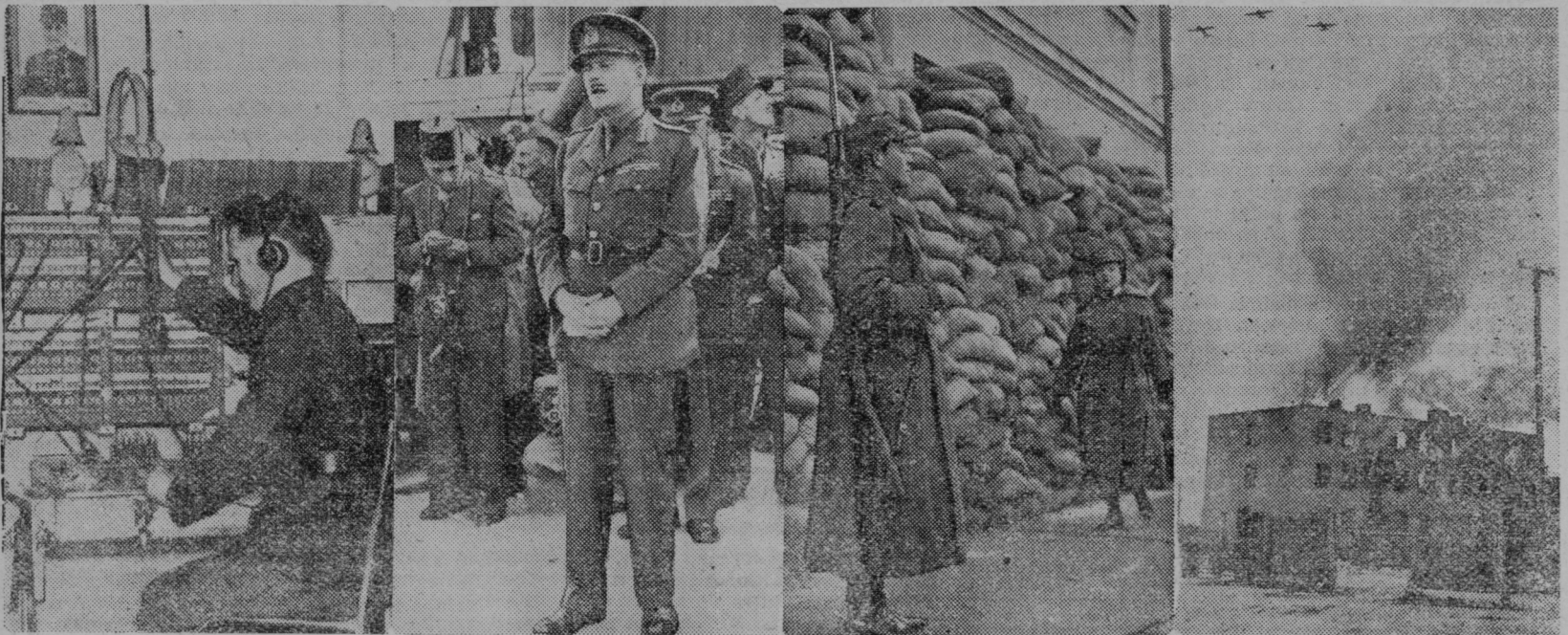
Na bojišču je zelo važna telefonska služba — Telefonska celica v Maginotovi črti

Najstarejši Frankolovčan umrl. V ponedeljek, 4. marca, je v starosti 90 let zatislil oči ugledni