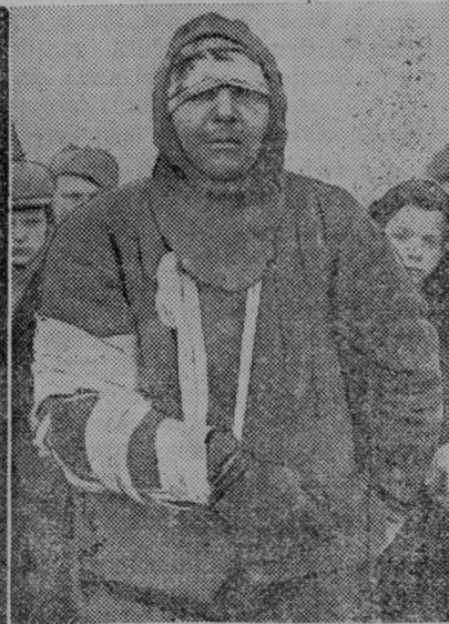
Slika na Finskem ujetega in ranjenega sovjetskega vojaka

smejo obupati. Pomanjkanja ne bodo trpeli. V skritih skladiščih pristave je dovolj moke, slanine, sočivja, sadja in belic. Obljubil je, da jim vsako noč prinese nekaj živeža.