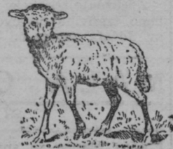
Ovca: 8—10 let