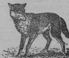
Volk: 12—15 let