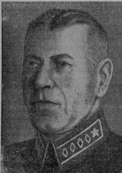
B. Šapošnikov, šef sovjetskega generalnega štaba

Brusilna plešča razbila materi glavo. Minka Kapusova, 40 letna žena pismonoše v Radvljici na Gorenjskem, je bila zaposlena v tovarni okovov. V delavnici so preizkušali no-