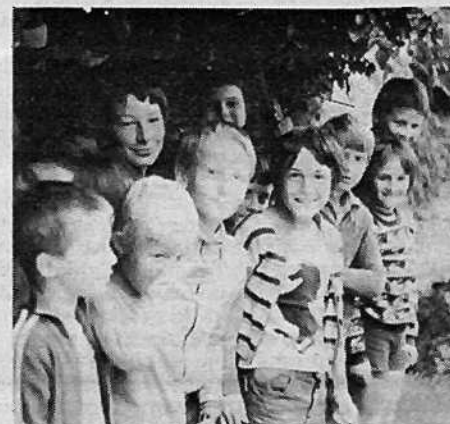
Pa recite, da niso kljukci (če pa so)!

bi pomagale. Najraje pa so pomagali peljati vozček po klancu navzdol (znajdljivi so, ni kaj)! Pravo veselje je bilo peči krompir na žerjavici, pozanimali pa so se tudi, če je res, da krava daje mleko. Največji