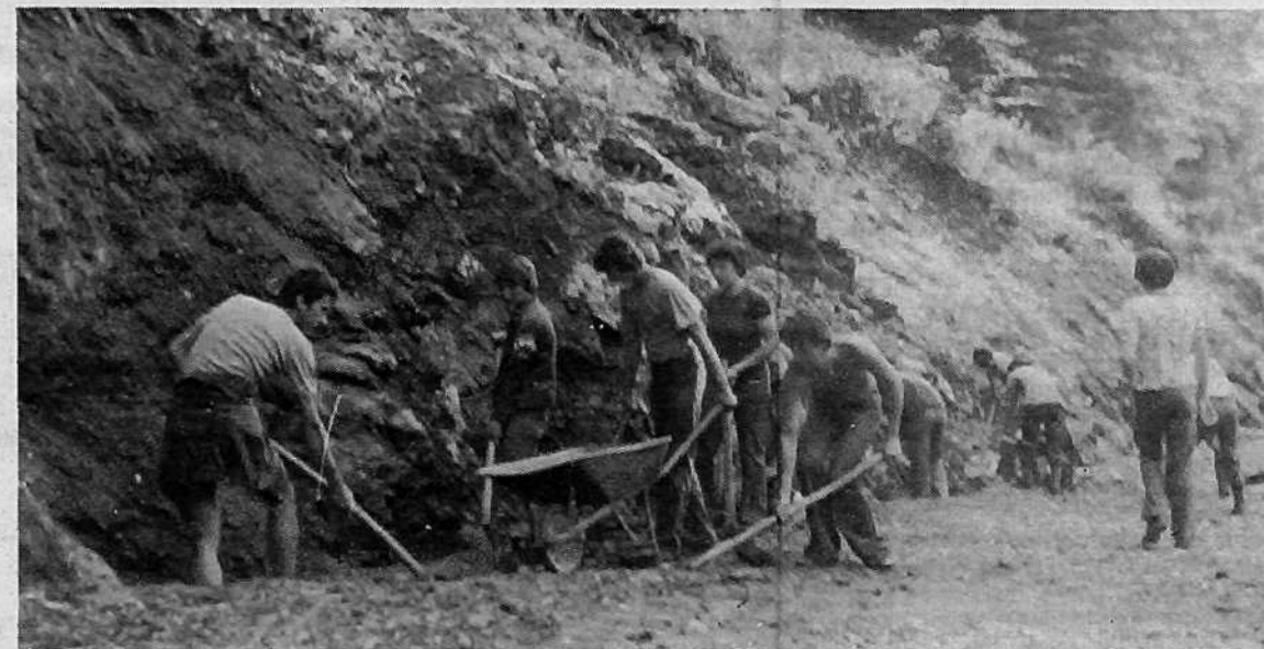
Dekleta in fantje iz Centra gradijo pot, ki bo vodila h kraju, kjer je bil med sovražno ofenzivo ranjen tovariš Tito.

tre dolgega vodovoda od izvira Skakavca do Tjentišta in daljnovečja. Lahko vam povem, da so vsi brigadirji zelo pridni tako na trasi kot v naselju, da so vaši ljubljanci zelo marljivi graditelji. Med brigadirji je četrtina deklet, zastopane pa so vse mladinske strukture: šolska, vaška, delavska, stu-