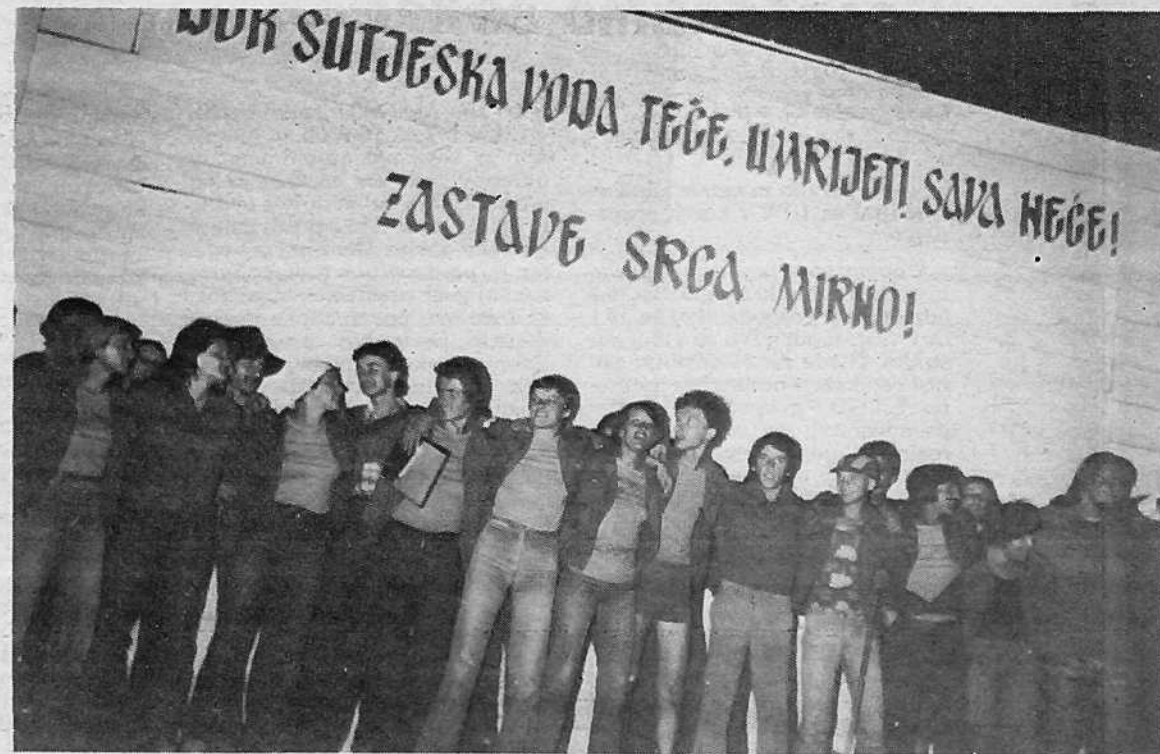
MED BRIGADIRJI CENTRA NA SUTJESKI 77