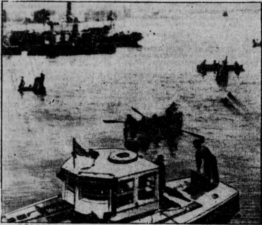
Radio slika eksplozije v Newyorku. Colni zaman iščejo ponesrečencev z ladje >Observation<, ki je radi eksplozije zletela v zrak in se na mestu potopila.

>Praviš, da se ti je prikazal Beethoven? Kaj pa ti je povedal?< >Prosil je mojo ženo, naj nikar več njegovih sonat ne igra.<