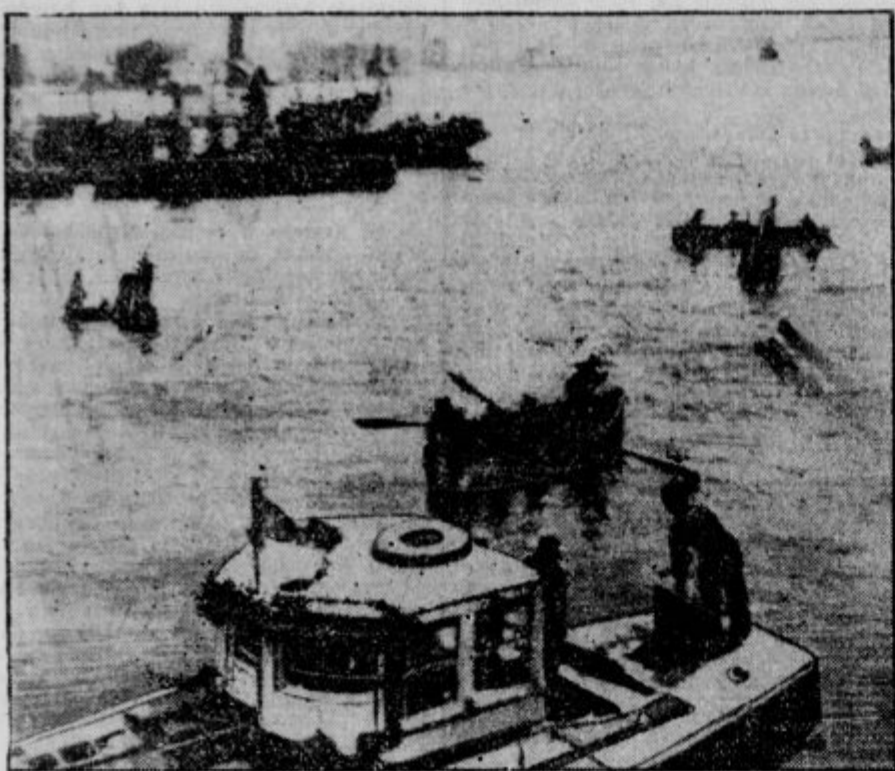
Radio-slika eksplozije v Newyorku. Colni zaman iščejo ponesrečencev z ladje >Observance<, ki je radi eksplozije zletela v zrak in se na mestu potopila.

>Praviš, da se ti je prikazal Beethoven? Kaj pa ti je povedal?< >Prosil je moje ženo, naj nikar več njegovih sonat ne igra.<