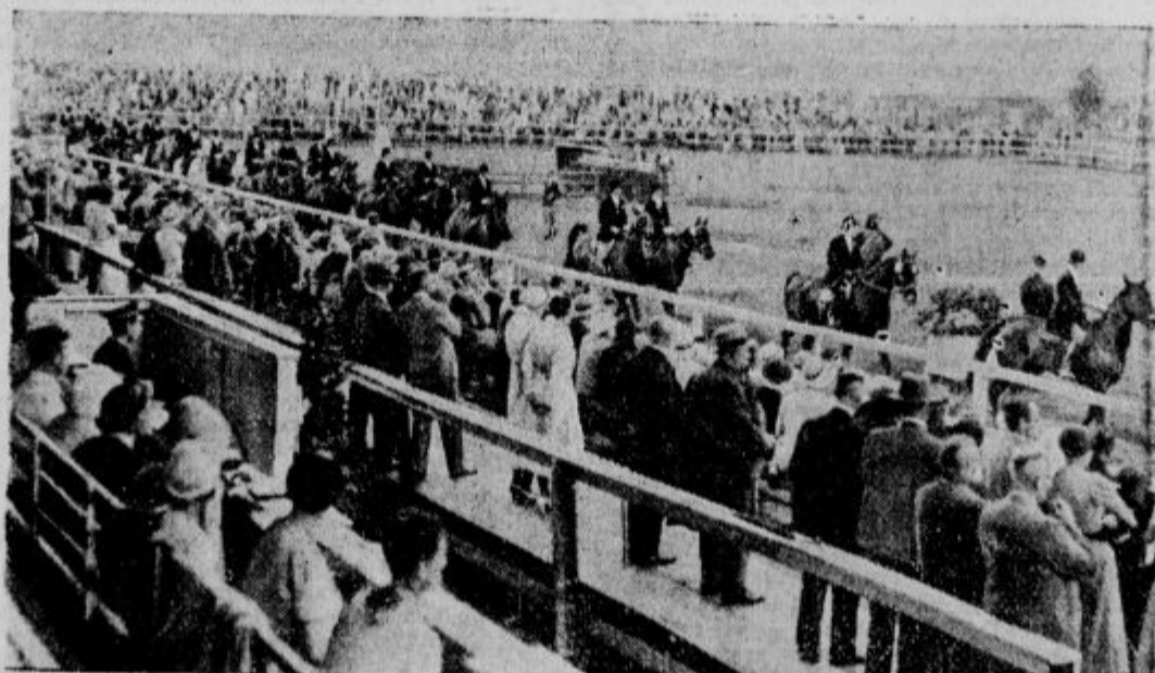
Prvi mednarodni ženski turnir na konjih, ki se vrši v Düsseldorfu, bo obsegal razne jahalne in skakalne vaje. Sodelujejo Holandija, Avstrija, Madžarska in Nemčija. Slika nam kaže vprav vstop udeleženk v stadion, ko jih pozdravlja v imenu mesta Düsseldorfski nadžupan. — Kak smisel ima lovstveni šport za žensko, je kajpa drugo vprašanje.

>Povejte mi, kaj berete in povem vam, kdo ste!< >Berem Ovida, Vergila, Demostena in Homerja...< >Vi ste velik lažnik...<