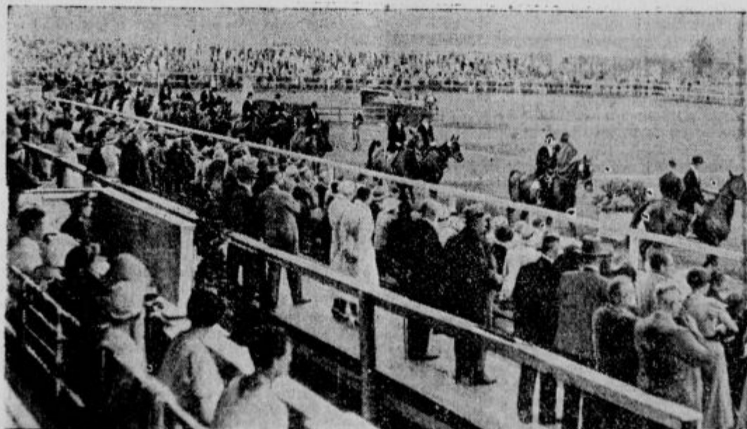
Prvi mednarodni ženski turnir na konjih, ki se vrši v Düsseldorfu, bo obsegal razne jahalne in skakalne vaje. Sodelujejo Holandija, Avstrija, Madžarska in Nemčija. Slika nam kaže vprav vstop udeleženk v stadion, ko jih pozdravlja v imenu mesta düsseldorfski nadžupan. — Kak smisel ima tovrsten šport za žensko, je kajpa drugo vprašanje.

>Povejte mi, kaj berete in povem vam, kdo ste!< >Berem Ovida, Vergila, Demostena in Homerja...< >Vi ste velik lažnik...<