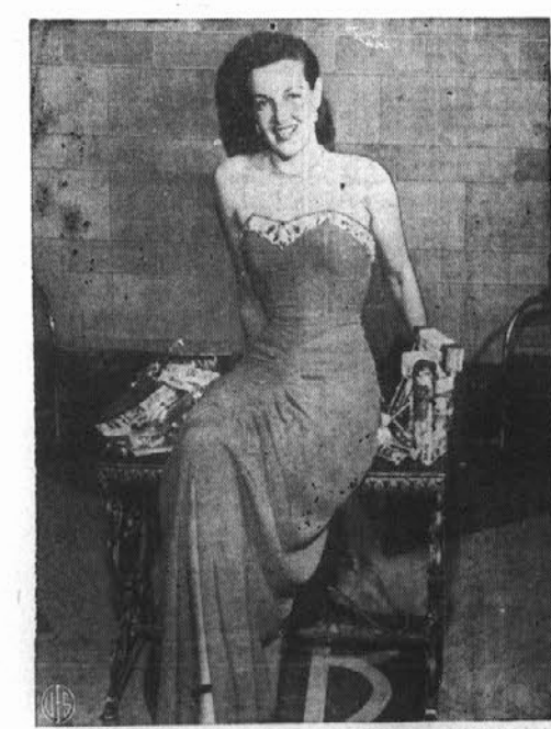
CANDY QUEEN—Film star Jane Russell was unanimously elected Candy Queen at the convention of the Confectioners Association in New York City. Miss Russell was selected from a list of over 150 movie stars.