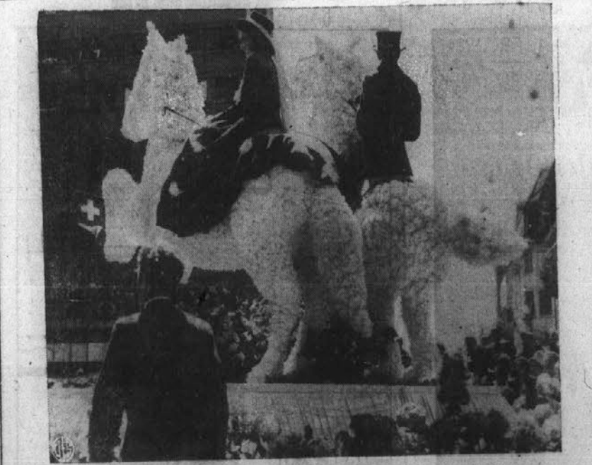
Švicarsko urarsko mesto Bienne praznuje svoj letni "Fraterie festival," v katerem je združen način proslave našega "New Orleans Mardi Gras" in "Pasadena Tournament of Roses." S tem festivalom so pričeli leta 1932 in ga sedaj ponavljajo vsako leto. Slika nam predstavlja eno izmed flot iz tega festiva.

Pomagajte Ameriki, kupujte Victory bonde in znamke.