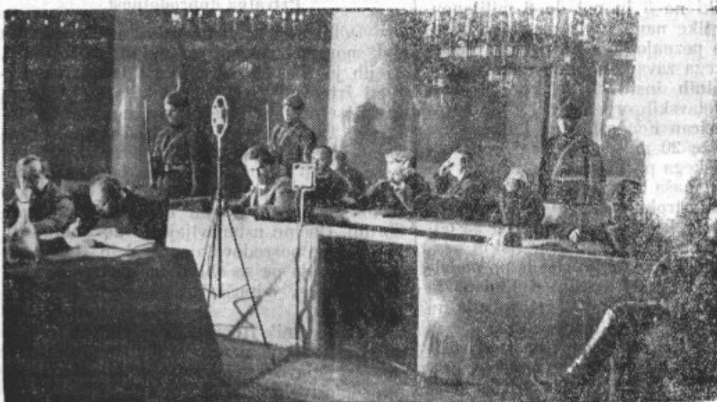
Velik proces v Moskvi.