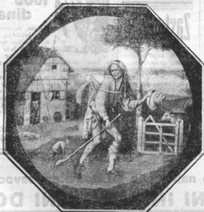
Slika, ki je bila prodana za 5 milijonov 250 tisoč dinarjev.

Ko je bil Ampere profesor na pariški Politehniku, ga ni bilo dneva, da ne bi bil obrisal table s svojim robcem, čela pa s cunjjo za brisanje table.