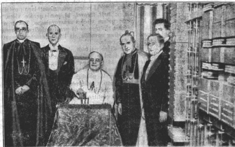
Na sliki vidimo, kako Sv. Oče pritiska na gumb, nakar je bila vpostavljena zveza med Vatikanom in zunanjim svetom. Na levi strani slike stoji državni tajnik Pacelli, bivši zastopnik Vatikana v Berlinu.

Pregled živil v Ljubljani. Mestno tržno nadzorstvo redno jemlje vzorce raznih živilskih potrebščin v svrhu kemične preizkušnje. Preglede izvršuje drž. higijenski zavod, oddelek za preizkušnjo vode in živil v Ljubljani po inženjerjih kemije — strokovnjakih, ki imajo za take znanstvene preizkušnje posebne izpite. Preizkušnje se vršijo na podlagi zakona o nadzorstvu nad živilo oz. pravilnika k temu zakonu. Pregledi vzorcev, ki jih pošlje tržno nadzorstvo, so brezplačni, če se ugotovi, da je blago pravilno, drugače pa plača lastnik pristojbino, ki je zelo visoka. Za vzorce, vpslane po zasebnikih ali proizvajalcih pa se plačujejo pristojbine, ki so predpisane. Tržno nadzorstvo je poslalo pretečni mesec v pregled 117 vzorcev raznih živil in poživil (meso, mleko, mlečni izdelki, specerijsko blago, začimbe itd.). Od teh vzorcev jih 12 ni odgovarjalo predpisom pravilnika, ker so bili bodisi napačno deklarirani, bodisi neprimerni ali pa pokvarjeni odn. neužitni. Vsi, ki so se prekršili zoper predpise zakona odn. pravilnika, morajo plačati visoke pristojbine za pregled, poleg tega bodo pa še kaznovani s kaznijo v denarju do 10.000 Din ali z zaporom do enega meseca, v težjih primerih pa se uporabita obe kazni. Ker so predpisi za kvaliteto blaga po pravilniku popolnoma določeni, je vsakdo, ki prodaja ali ponuja neprimerno blago, kazniv, ako to izkaže uradna preiz-