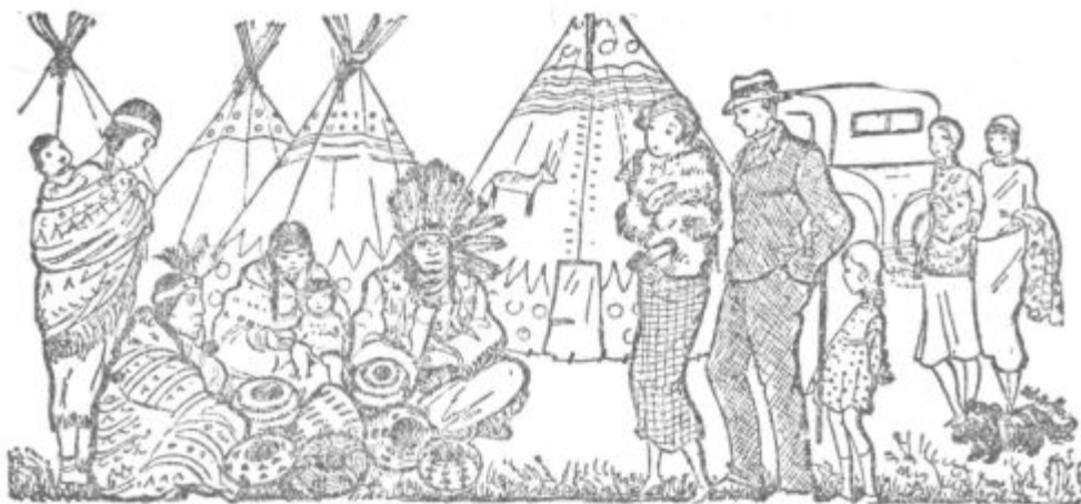
Časih se pokažejo Indijanci v svojih starih nošah. Tedaj prihajajo trume ljudi, da si ogledajo ta prizor.