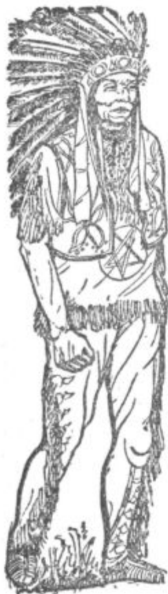
Nekoč je šel »Edečl volke« s perjem okrašen na lov na bivole in...