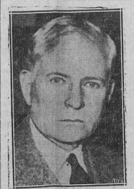
Senator Elmer Thomas iz Oklahome, ki je bil ponovno nominiran v primarnih volitvah. Priporočil ga je volivcem predsednik Roosevelt.