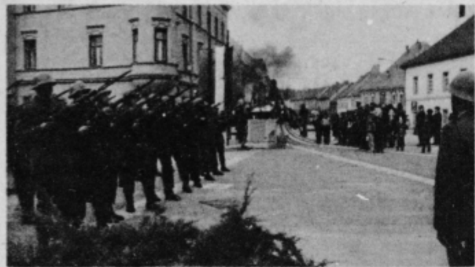
Častna salva pripadnikov garnizije Pohorski bataljon, je odjeknila v renetkih globoko tišine ob spomeniku NOB v Slovenski Bistrici

Na območju občine Slovenska Bistrica je skupno 36 spominskih obeležij, ki nas spominjajo na najbolj krvava leta boja slovenskega ljudstva skupaj z vsemi jugoslovanskimi narodi v letih 1941—1945. Čeprav tudi ob drugih dnevih skozi vse leto ta obeležja niso pozabljena, se jih ob dnevu mrtvih še posebej spominjamo, da tako počastimo žrtve NOB, obudimo spomin na vse tiste, ki jim ni bilo usojeno užiti plodov za katere so se borili.