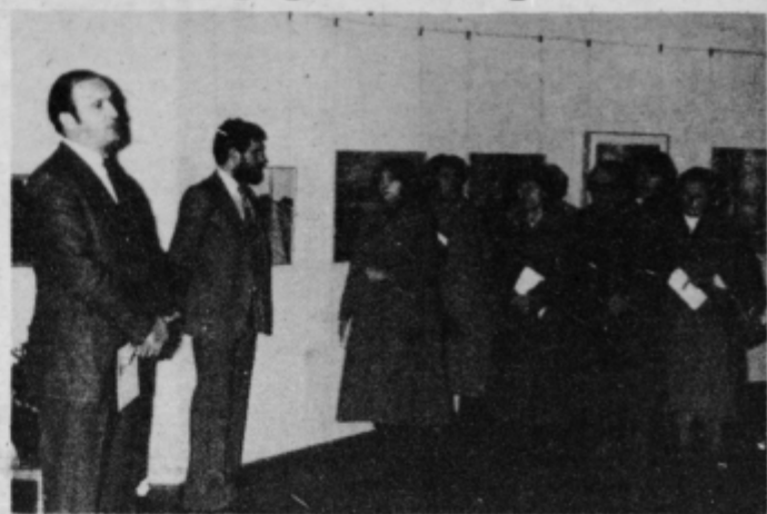
Ob otvoritvi razstave del članov likovnega združenja Varaždin.