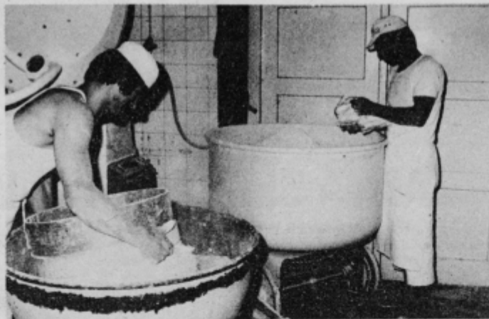
Mnogo ročnega dela pri pripravi testa

Mogoče je prav, da o novogradnji mislijo tudi drugi dejavniki, ne le Intes, saj se bodo sredstva vračala iz dohodka delovne organizacije, o čemer priča ekonomska upravičenost novogradnje, v Pekarni pa pravijo, da bodo anuitete lahko sami takoj vračali. Pripravljeno je tudi že zemljišče, preizkave zemljišča so opravljene,