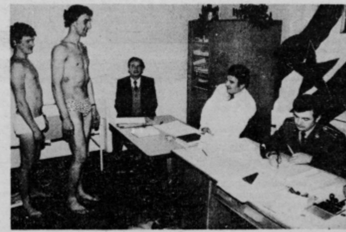
Delo naborne komisije v Juršincih

V ponedeljek, 10. novembra so končali z nabori v Juršincih, kjer so jih opravili skupno za KS: Juršinci,