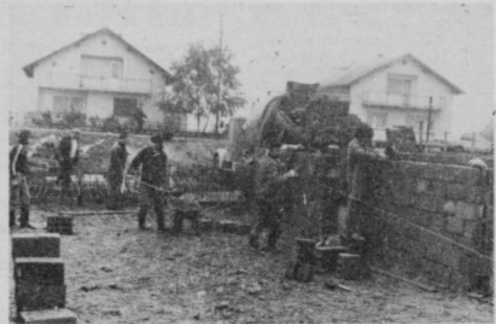
Prostovoljno delo, da bo dom hitreje zrastel

V krajevnih skupnostih mesta Ptuj prav sedaj na zborih občanov razpravljamo o srednjeročnem programu razvoja krajevnih skupnosti. V krajevni skupnosti Budina—Brtstje bodo v naslednjih petih letih poskušali realizirati precej akcij, omenim pa naj nadaljevanje gradnje doma občanov, asfaltiranje ulic v naselju, ureditev kanalizacije ob