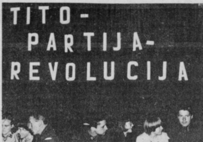
Zmagovalna ekipa iz OŠ Miklavž pri Ormožu (desno)