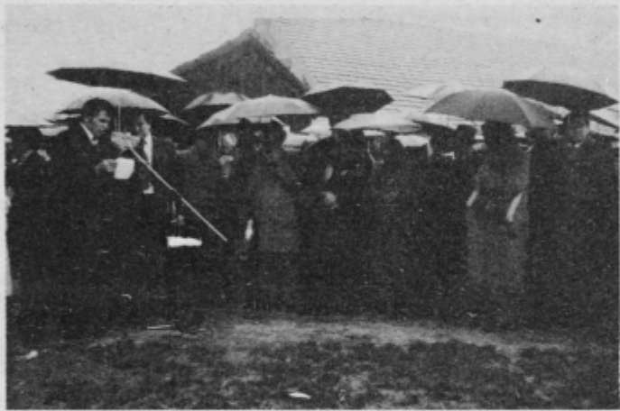
Še tako deževno in hladno vreme ni omrtvilo partizanskega mitinga v Laporju.

Osrednji letošnji dogodek v okviru malega Borštnikovega srečanja pa je bil v soboto, 25. oktobra popoldne v vasi Laporje, kjer je bil pod kozolcem domačije pri Jugu pravi partizanski miting,