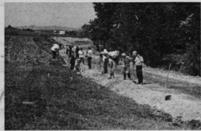
Urejanje bankin ob pravkar asfaltirani cesti — sodelovali so stari in mladi

V letošnjem letu je večkrat narasel potok Rogoznica, odnesel stari leseni most. Čezenj pelje bližnja pešpot do Destrnika, istočasno pa je bila pot po kateri so vozili košenine s travnikov, ležečih ob potoku. Zaradi potreb in predvidevanj po regulaciji potoka Rogoznica so se odločili za izvedbo lesenega mostu. Akcija od začetka do izvedbe je stekla v enem mesecu. Zbrali so sredstva za žaganje lesa in delni nakup hrastovine. Ostali les, material in delo so prispevali sami. Na istem mestu stoji most, je udobna pot, ki starejšim in otrokom, ki se odločajo peš skrajša pot, Most so tudi impregnirali.