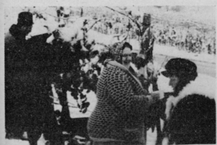
Ko so se obiralcem pridružili delavci Tovarne »Jože Kerenčič«, je bilo trsje pokrito s snegom in ledom, kar enodnevnih bračev ni motilo.