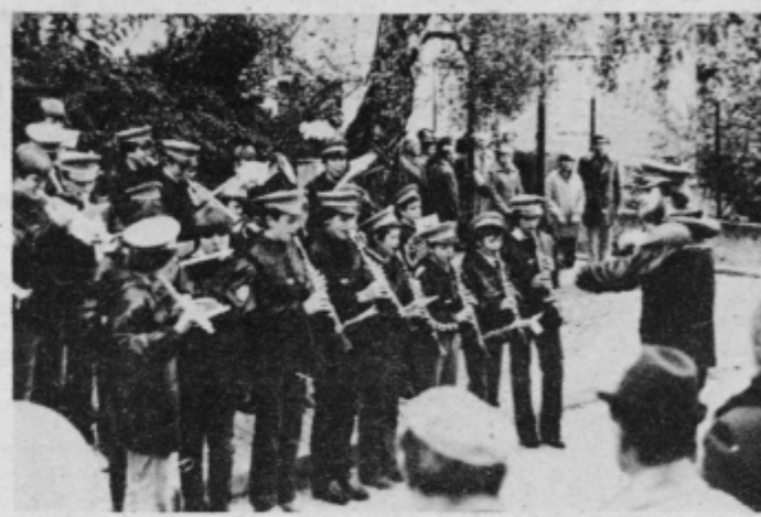
Pihalni orkester na žalni svečanosti.

„Nesteto lučk smo prižgali v spomin preminulim borcem in graditeljem naše sedanosti, misli, da jih ni več med nami, se nenehno pridružuje ponos ob spoznanju, da smo dediči ponosnih in hrabrih ljudi, ki se niso uklonili bremenu tisočletnega suženjstva in imperialističnih težnjam fašistične