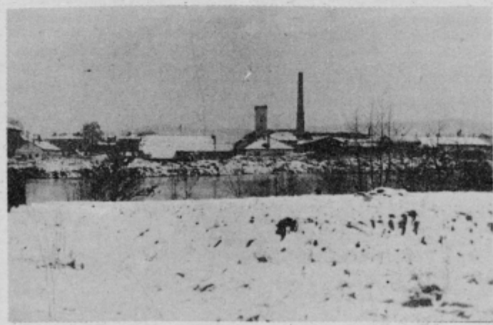
Zgodnji sneg je prekril od opečnega prahu rdeče strehe okrog Opekarne na Pragerskem

Nepričakovana snežna odeja, zlasti pa dodatno sneženje iz dneva v dan je zaskrbelo predvsem kmetovalce tako zasebne, kot one iz družbenega sektorja. Na območju bistriške občine je v družbenem sektorju ostalo v vinogradih še precej neobranega grozdja. Na srečo solidarnost tudi tokrat ni odpovedala. Vodstvo KK Slov. Bistrica se je obrnilo na delovne organizacije za pomoč delavcev pri obiranju grozdja. Prošnja je naletela na polno razumevanje, zato je v torek, 4. novembra čez sto delavcev iz raznih kolektivov zamenjalo delovne stroje z rokavicami in putami ter pomagalo pri trgatvi.