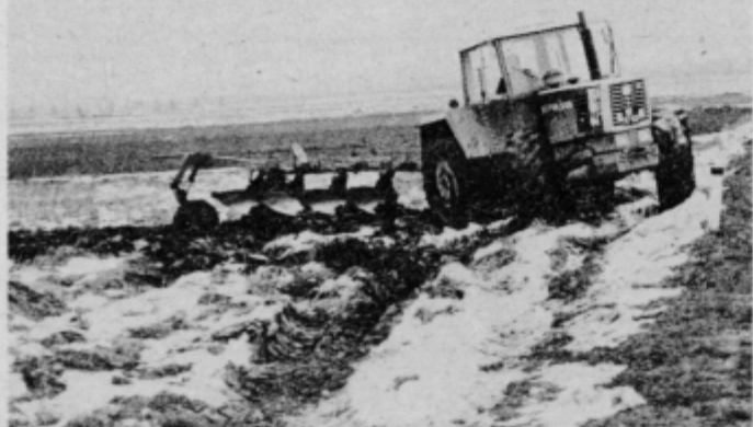
Kolesa so se vrtela na mestu

Kmetje so nejevoljno čakali, kdaj bo sneg skopnel, ta pa je izginjal vse prepočasi in že prejšnji teden so se nekateri kljub vsemu lotili dela. Nekateri so pod snegom iskali jabolka, drugi so pospravljali