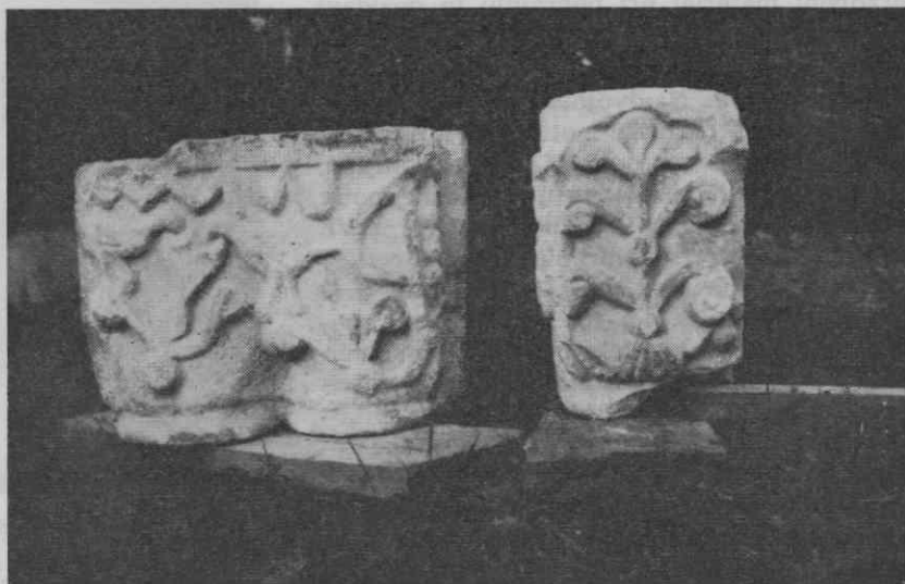
Kapitela, najdena 11. avg. 1969 v levem stebri pokopališčne ograje ob glavnem vходу.

Nato so 15. junija 1834 začeli s popravilom pokopališčne ograje, ki so jo delno izboljšali, v ostalem delu pa izenačili, dopolnili z novim odsekom zaradi razširitve pokopališčnega prostora.