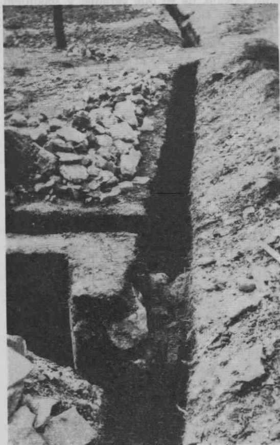
Zidovi pod zemljo. Ob kopanju jarkov za vodovodne cevi leta 1965 so odkrili spodnje dele srednjeveške zgradbe, in sicer pred špitalsko cerkvijo in na severni strani stoletne lipe.

b) V istem času so bili odkriti sledovi srednjeveške zgradbe na področju župnijske-