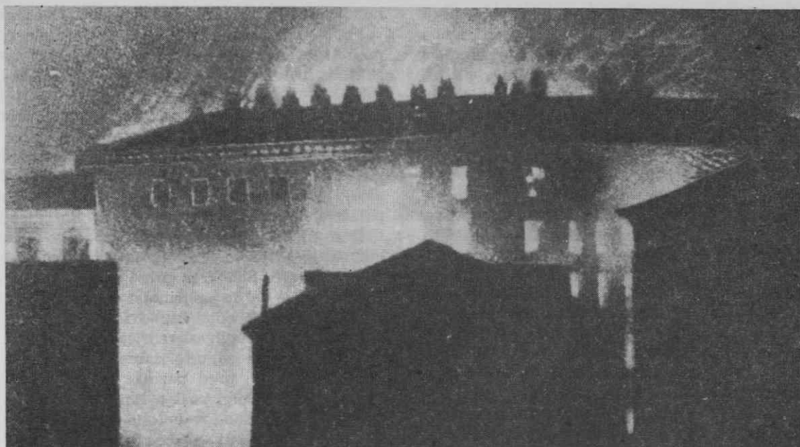
Narodni dom v plamenih, posnet v noči od 13. na 14. julij 1920.

Toda italijanskim nacionalističnim prena-petežem ni bilo za to, da bi se ugotovili krivci, in niso čakali, da bi se ustanovila komisija. Incident jim je bil zaželen ali, kakor kaže, celo sporazumno izvabljen za široko zasnovane teroristične izpade proti slovenskemu in hrvaškemu prebivalstvu na okupiranem ozemlju. Vodstvo te akcije je prevzel leto dni prej ustanovljeni tržaški fašjo s svojimi akcijskimi četami ( squadre d'azione ).