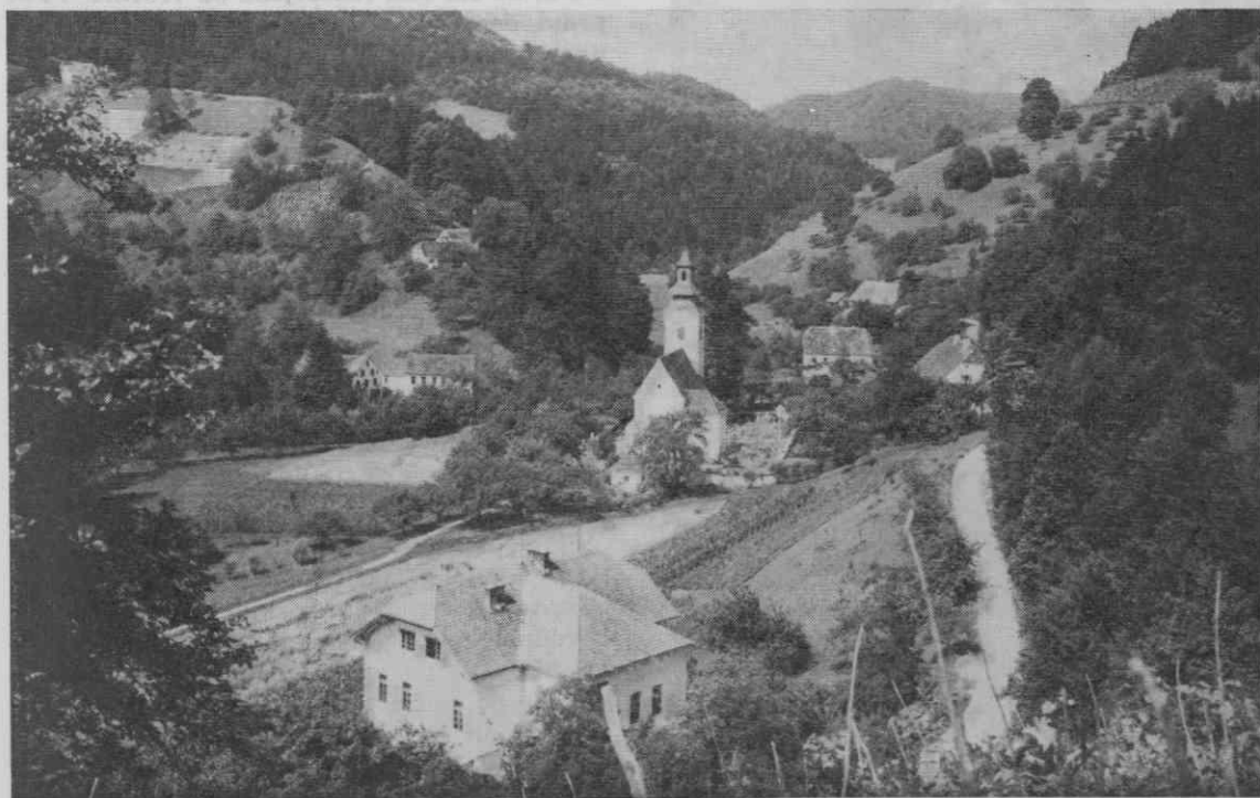
Spitalič pri Konjicah. Cerkev je iz konca XII. stoletja, druge zgradbe na sliki pa iz XIX. in XX. stoletja.

V nadaljevanju navajam nekaj važnejših podatkov o najdbah, ki so prišle na dan ob