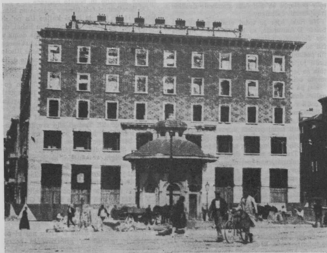
Narodni dom po požigu, ko je čas že delno izpral sledove plamenov in dima.