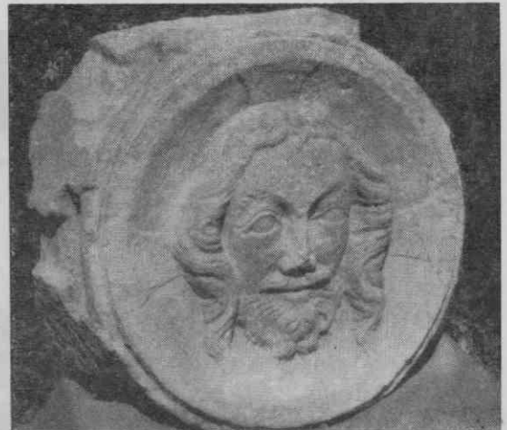
Sklepnik: Kristusova glava, verjetno najden 12.—13. junija 1834 ob čiščenju ruševin iz špitalskega pokopališča, kjer so odkrili sledove cerkvene zgradbe. Leta 1843 so sklepnik vzdali nad vhod v zakristijo.

Ob sinodah kartuzijanskih priorjev se je spremstvo le-teh ustavljalo v spodnjem samostanu pri kartuzijanskih bratih. Ob teh