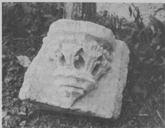
Gotska konzola, najdena leta 1956 v stebri pokopališčne ograje ob severnem vходу.

logo opeke. Dva kosa opeke iz podvaljene opekarne sta spravljeni v cerkvenem lapidariju.