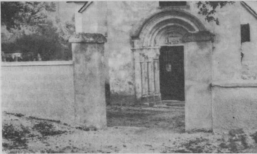
Levi steber pokopališčne ograje pred portalom cerkve je najdišče obeh kapitelov in še drugih obdelanih kamnov.

Delno pojasnilo, kaj so našli na pokopališčnem prostoru leta 1834, pa nam prinaša sedanji čas.