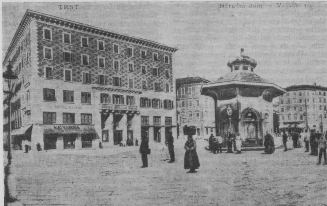
Narodni dom v Trstu pred požigom.

V gledališni dvorani so se zbirali tržaški Slovenci tudi na političnih zborovanjih in na drugih sestankih, tam so bili tudi koncerti in druge kulturne manifestacije ter plesi.