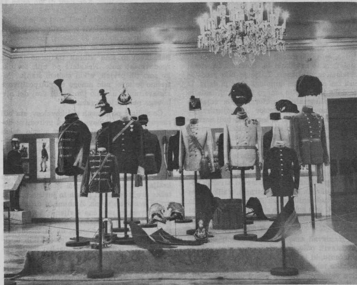
Skupina uniform na razstavi »Uniforme v zgodovini« v Pokrajinskem muzeju v Mariboru v jeseni 1969

Čeprav torej nimamo v muzejih mnogo izvornih uniform in je precej težko podati bolj ali manj sklenjen prikaz oblačilnega razvoja ter predstaviti vse, kar se je skozi stoletja nosilo pri nas, se je mariborski muzej odločil za razstavo te vrste. Z njo smo želeli doseči dva cilja. Predvsem je bil naš namen, da tudi v našem muzejstvu odmerimo primerno mesto preučevanju in zbiranju uniform, se pravi panogi, ki je doslej skorajda nismo poznali, četudi je v svetu zelo razširjena in je