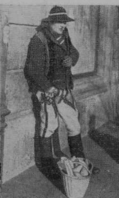
Slika nam kaže holandskega ribiča, ki se je vrnil s celonočnega lova na morju zopet domov