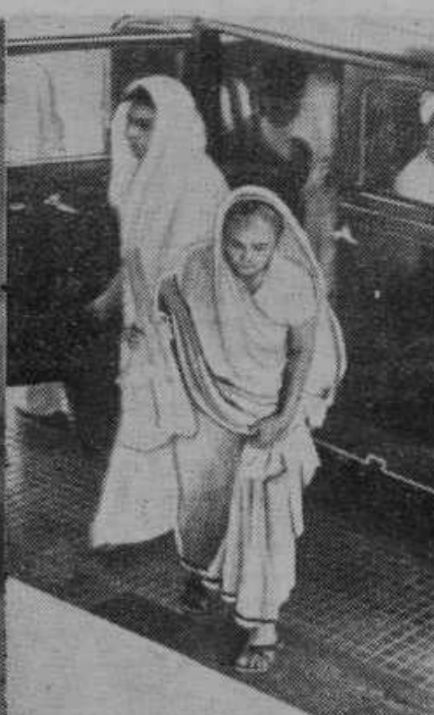
Posnetek žene voditelja Indijcev Gandhija, ko zapušča avtomobil na agitacijskem potovanju

bila kakor ulita. Ni bila kaka posebna lepota, toda njene svetlomodne oči, njeni temnorjavi gosti lasje so dajali obrazu neko neizrekljivo mikavnost. Bila je nekoliko bleda, videz pa ji je bil še tako mladikast, da bi ji bil prisodil kvečjemu trideset let, čeprav jih je že izpolnila pet in trideset.