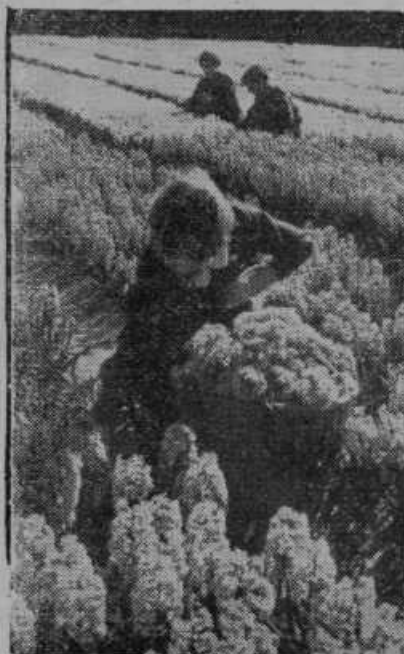
Pomlad na Holandskem. Na sliki vidimo cvetoče hijacinte v bližini znanega mesta Haag