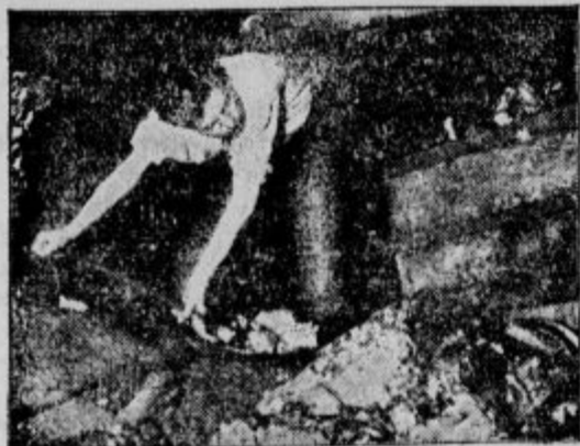
Rudar naklada premog na vozček.

Za vsakega je jasno, kakšen mora biti konec. Teža so se zavedali tudi redakterji uredbe. Vsled tega so se zavarovali pred polinom s tem, da so vnesli v pravilnik določila, na podlagi katerih se smejo jemati ru-