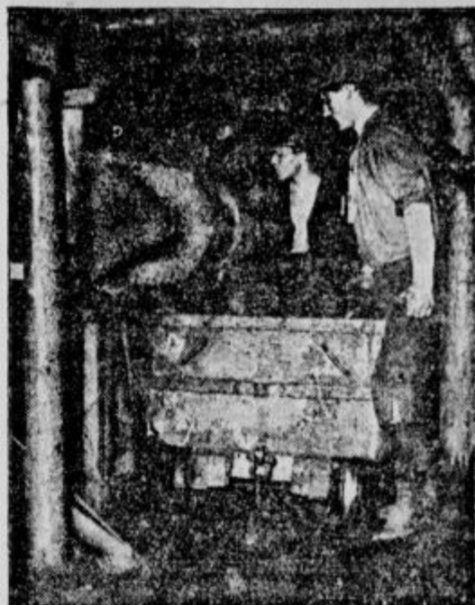
Stroj vauja premog na vozček.

Tisti, ki so se ali se bodo upokojili po 1. januarju 1925, imajo priznana leta službe, za kritje njih rent pa ni denarja. To kritje treba dobiti iz izvanrednimi prispevki države in podjetij maksimalno z 1.5% zavarovane