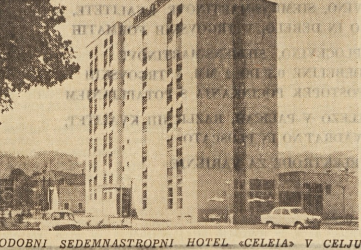
SODOBNI SEDEMNASTROPNI HOTEL »CELEIA« V CELJU

37 km, ker smo vozili po ovinkih; najkrajša cesta je bila namreč tedaj zaprta, ker so jo asphaltirali. Vse ceste peljejo skozi samo zelenje, vsi kraj niso enako bogati, a iz nobenega ne štrli proti nebu niti ena skala. Zdravilišče »Rogaško Slatino« poznate, mnogo Tržčanov zahaja tja iskat zdravja in počitka. Rogaška voda zdravi posebno prebavne organe, zlasti pa jetra in žolc. Slovitih vrelic »Tempel«, »Styria« in »Donat« ne boste našli več na starem mestu. Po nasvetu nekoga bosenskega inženirja so vodo pred nekaj leti zajeli globlje — skoraj 50 metrov pod zemljo, ker so prejšnji vreli skoraj ne površini, jeli pesati in niso imeli pravega pritiska. Napravili so kar 40 vrtnj, a so pozneje razen teh treh vse zaprli, da bi bil pritisk na ten močnejši. Zdjaj lahko vidis s prostim oesom, kako voda brez izpod zemlje ter nato odhaja v polnilnico, kjer jo vsteklencijo, al v zdraviliško kopalnišče. Polnilnico so modernizirali, novih stavb sicer ni videli, pač pa zdaj gradijo novo 11-nadstropno hišo, kjer bodo zbrali vse naprave za zdravljenje (hidroterapijo) in odprli potrebne ambulante. Kakor veste, ima Rogaška Slatina eno izmed najlepših dvoran v Jugoslaviji. Ko so pripravljali veliko mednarodno konferenco nevezanih držav, je nekdo sprožil misel, da bi bila konferenca lahko v Rogaški Slatini, in sicer v tej dvorani. V resnici ni morda Rogaška Slatina samo za bolne, temveč za vse, ki se želijo odpočiti v sodobnem zdravilišču sredi gozdov.