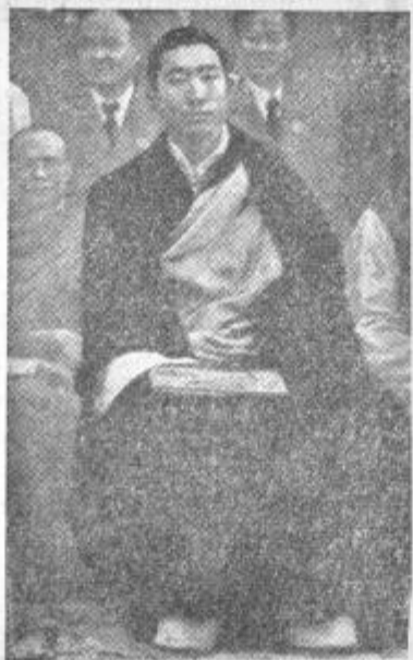
... Pančen Lama v Peking