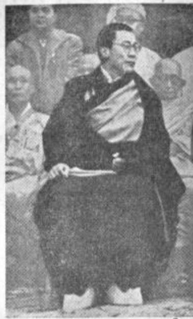
Dalai Lama v Indijo...