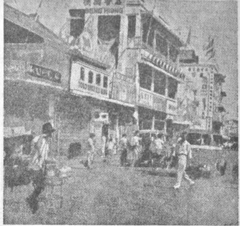
Prenajranost mest je treba rešiti s selitvijo