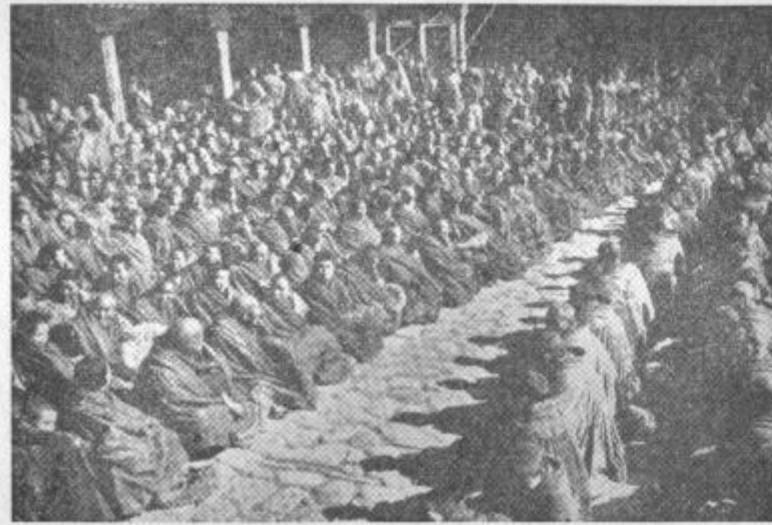
Dvajset odstotkov moškega prebivalstva v Tibetu so menihi