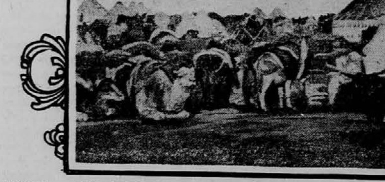
KABILI — ALI PREBIVALCI MAROKA — KTERI SO PORAZILI ŠPANCE. (Zgoraj kabilska krasotica, v sredi kabilske taborišče in spodaj kabilski bojevnik.)

ri potresovo ozemlje 1000 štirjaških milj. Takega potresa v Mehiki že četrstoletja ni bilo. Mesto Chilpanchingo je razdejano in tudi od mesta Acapulco je le malo ostalo. Koliko je bilo pri tem ubitih ljudi, ni znano, vsekako bo de pa število žrtev preselago sto. V mestu Mexico je bil potres tudi jak, toda razdejano ni bilo izredno veliko. Največ je moralo prestatati prebivalstvo mesta Chilpanchingo, katero mora selaj bivati na prostem. Koliko ljudi je bilo tam ubitih, naravno ni natančno znano. V imenovanem mestu je trajal potres še vso noč in poleg tega je deževalo, kakor že dolgo ne. Prvi potresni sunek se je pripetil zjutraj ob 4.15 in je bil tako jak, da so pričeli zvonovi raznih cerkev v tujakšnjem mestu sami zvoniti in da se je po posameznih stanovanjih pobilo mnogo posode. Jedva da so se prebivalci tukajšnjega mesta nekoliko pomirili, že se je pripetil drugi potresni sunek, ki je bil še jačji kakor prvi. Valed tega so vsi prebivalci bežali na prosto. Velika poslopja so zadobila velike razpokline vendar se pa ni niti jedno podrla. V onih krajih pa, v katerih bivajo siromašnejši sloji prebivalstva, se je pa mnogo hiš podrla. Glasom policijskega izvestja, je bilo v Mexico Ciudad in okolici vsled potresa ubitih 6 oseb, dočim so bile štiri osebe nevarno poškodovane.