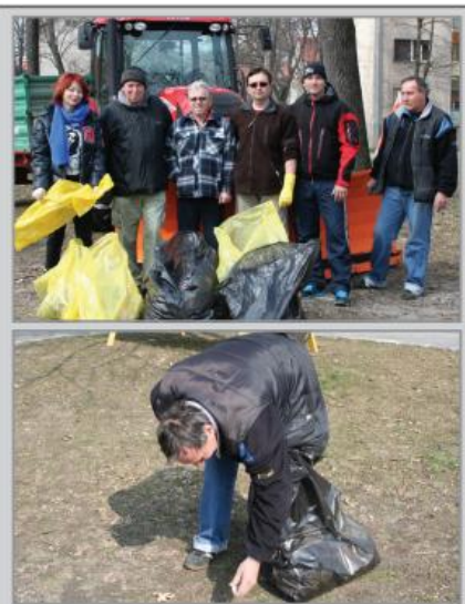
Utrinki iz letošnje čistilne akcije, ki je bila 23. 3. 2013. Na slikah je ekipa iz naselja Kidričevo.