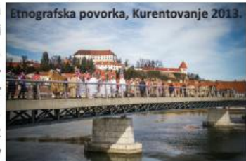
Etnografska povorka, Kurentovanje 2013.