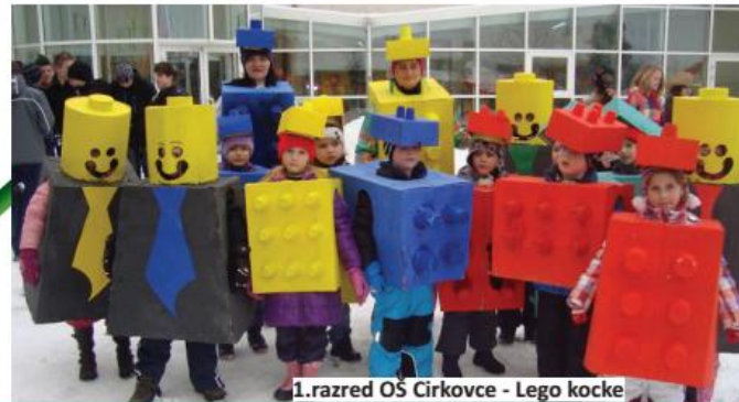
1.razred OŠ Cirkovce - Lego kocke