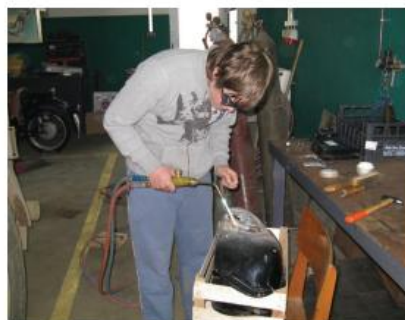
Zima v delavnicah naših članov