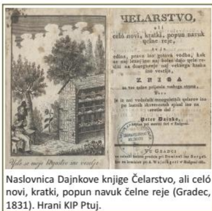
Naslovnica Dajnkove knjige Čelarstvo, ali celo novi, kratki, popun navuk čelne reje (Gradec, 1831).

der Windischen Sprache. Domoznanski oddelek ptujske knjižnice hrani nekaj redkih in dragocenih tiskov, v katerih se Dajnko predstavlja kot prevajalec zahtevnih svetopisemskih besedil, kot pisec samostojnih proznih del ter sistematičen poljudno-strokovni učitelj. Dajnko s svojimi deli ni samo izobraževal, temveč je v njih ohranil tudi neprecenljive zapise vzhodnoštajerske slovenščine prve polovice 19. stoletja.