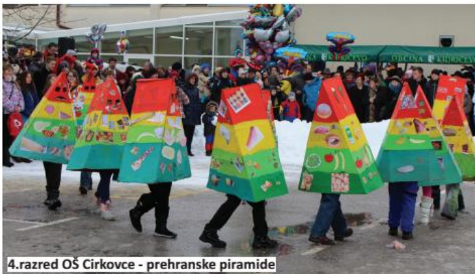
4.razred OŠ Cirkovce - prehranske piramide