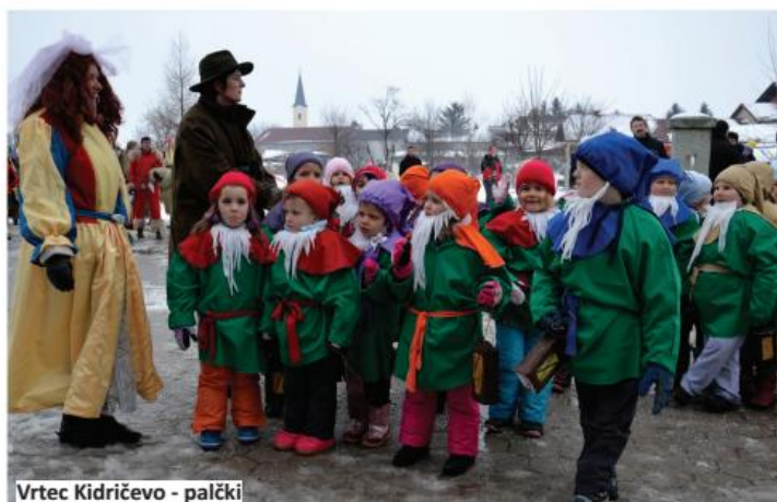
Vrtec Kidričevo - palčki