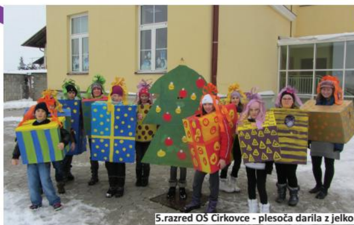
5.razred OŠ Cirkovce - plesoča darila z jelko