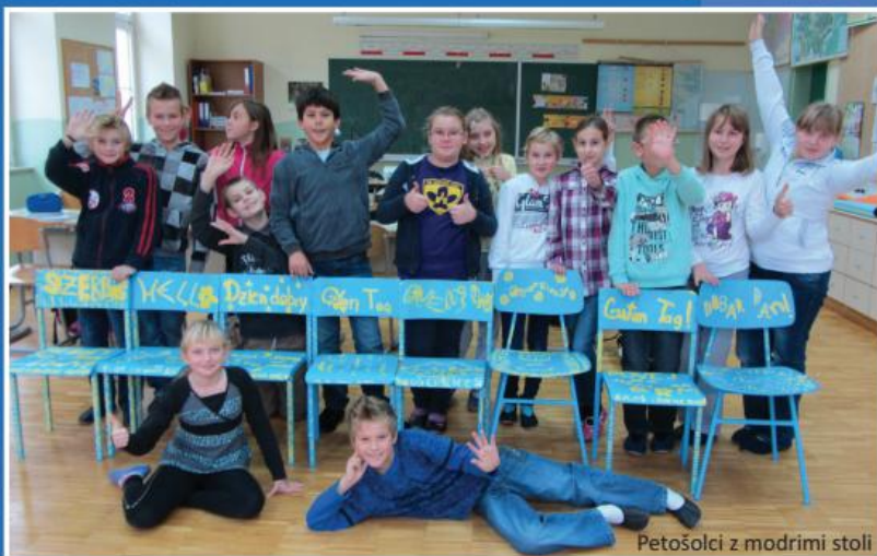
Petošolci z modrimi stoli