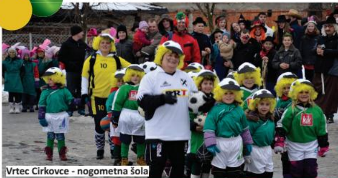
Vrtec Cirkovce - nogometna šola