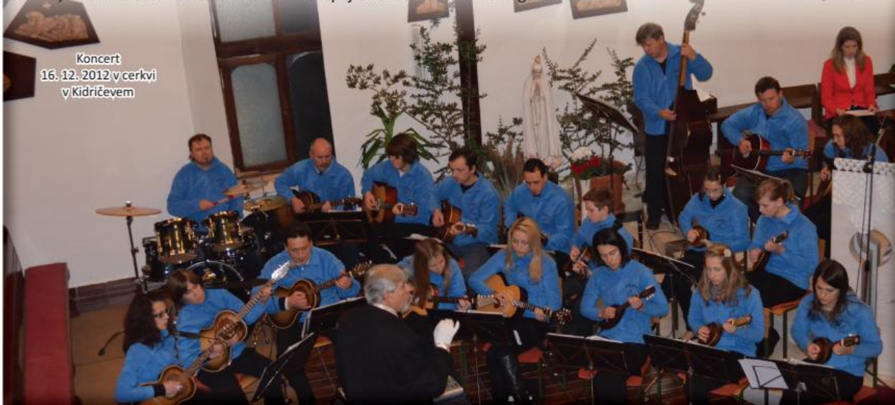
Koncert 16. 12. 2012 v cerkvi v Kidričevem