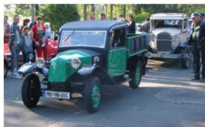
Spomin na srečanje v Kidričevem