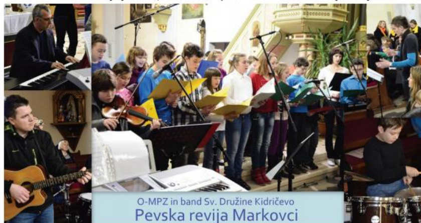
O-MPZ in band Sv. Družine Kidričevo Pevska revija Markovci