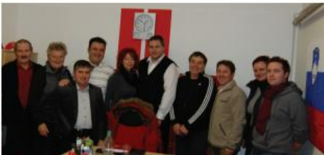
Poslanski večer z Dejanom Židanom.