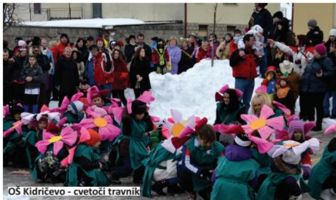
OŠ Kidričevo - cvetoči travniki