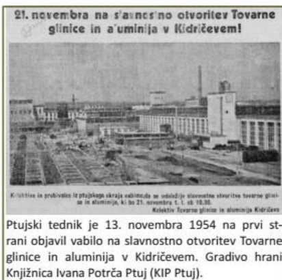
21. novembra na slavnostno otvoritev Tovarne glinice in aluminija v Kidričevem! Kritično in prodajno iz ptujskega kraja odločila se obdobje slavnostno otvoritev tovarne glinice in aluminija, ki bo 21. novembra s. l. ob 18.30. Kolektiv Tovarne glinice in aluminija Kidričevo. Ptujski tednik je 13. novembra 1954 na prvi strani objavil vabilo na slavnostno otvoritev Tovarne glinice in aluminija v Kidričevem.

2. Iz zgodovine Kidričevega: zgodovina Kidričevega je usodno povezana z dogodki v prvi in drugi svetovni vojni. Aprila leta 1941 je grad in posestvo v Strnišču prevzel nemški okupator in začel graditi taborišče za vojne ujetnike, naslednje leto pa še delovno taborišče za gradnjo tovarne glinice in aluminija. Ob koncu 2. svetovne vojne je bilo v Strnišču dograjenih 70 % tovarne. Po vojni sta strniško taborišče prevzela Jugoslovanska ljudska armada (JLA) in Oddelek za zaščito naroda (OZNA) in ga preuredila v taborišče za politične zapornike in internacijske pripadnikov nemške narodnosti v Sloveniji. Leta 1947 se je jugoslovanska vlada odločila za dokončanje gradnje tovarne, sočasno z gradnjo TGA pa se je vršila tudi izgradnja delavskega naselja.