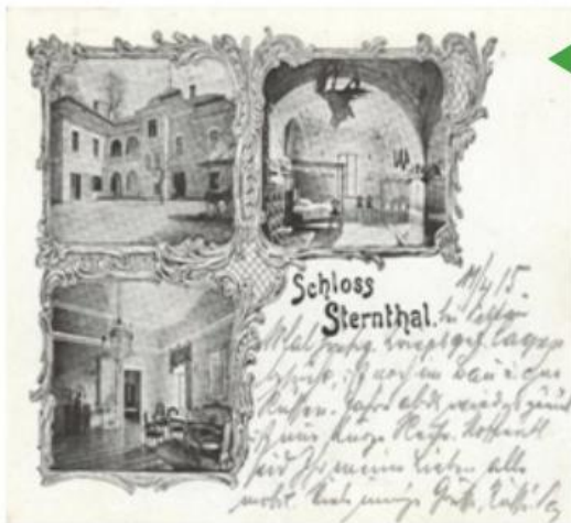
Razglednica dvorca Sternthal.