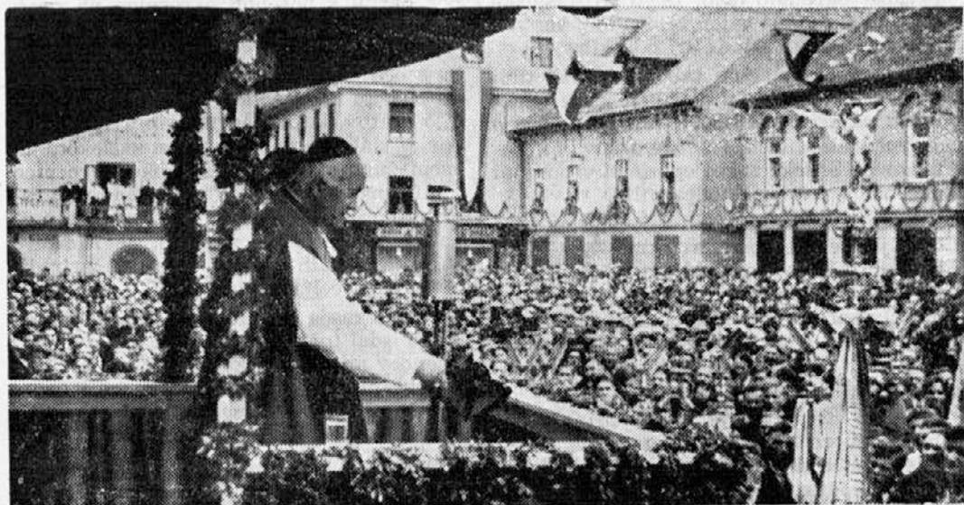
Nadškof dr. A. B. Jeglič govori slovenskim fantom svoj zadnji govor v Celju dne 29. junija 1937

Podvezin odbor se je zavedal ves čas, da je celjski tabor, na katerem bodo po dolgih letih fantje zopet prvič nastopili,