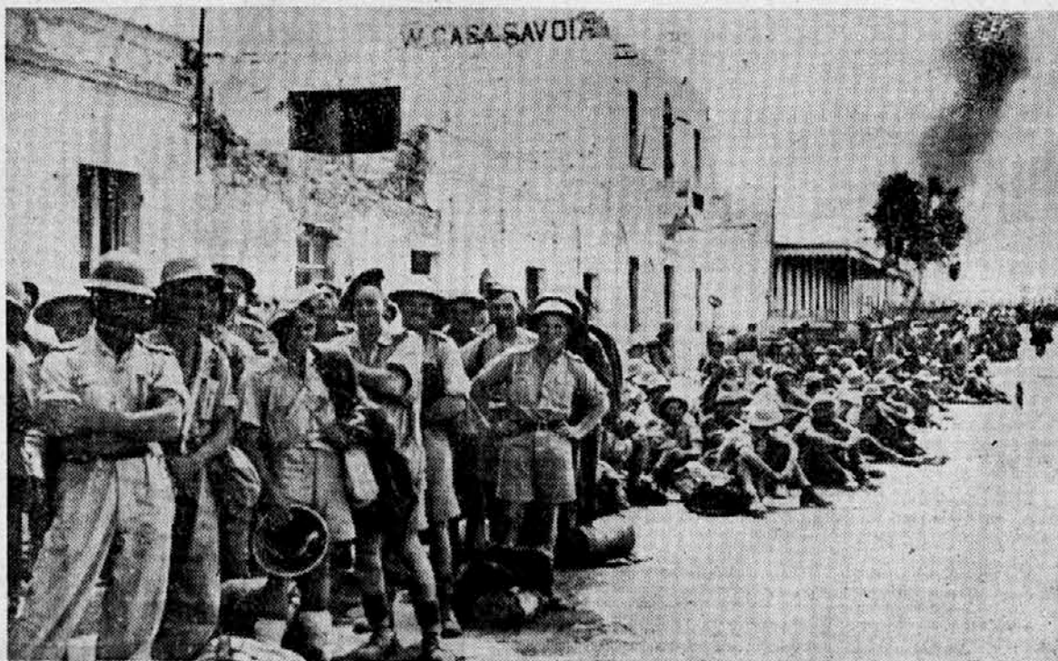
Angleški ujetniki čakajo na vkrcanjo.

Najvažnejši del spremljajočega brodovja se je vrnil med neprekinjeno akcijo naših letal. Del konvoja skuša doseči Malto. Nemško in italijansko letalstvo ga zasleduje in uničuje.