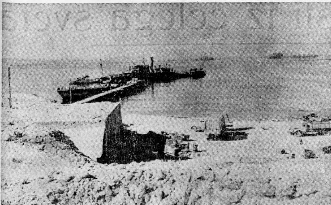
Tobruk: poškodovane ali potopljene ladje.

Letalstvo je razen tega bombardiralo sovražne čete na pohodu in pri vkrcavanju v severnokavkaskih lukah. Bojna letala so potopila v luki Anapa 4.000-tonsko trgovsko ladjo, nadaljnjo ladjo pa poškodovala z bombami. Nadaljnji letalski napadi so bili usmerjeni proti železnicam južno od Stalingrada. Pri tem je bil razdejan sovjetski oklopni vlak.