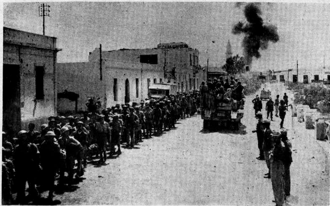
Angleški ujetniki med ruševinami Tobruka.

Poona je postalo svetišče za vse nacionaliste Indije, kateri akoravno ne pričakujejo od tam naloge, ker dobro vedo, da delovanje kongresa ni ustavljeno po izvršenih aretacijah, temveč da isto nadaljuje kakor v domovini tako tudi v inozemstvu s strani izbranih poslancev in Chandra Bosea, vendar z nestrpnostjo čakajo oni dan, kadar se bodo mogli oddolžiti s svojo zahvalnostjo Gandhiju, ker je on po tolikih letih s svojim pridigovanjem in s svojim primerom ustvaril močjo osvobojenja njihove zemlje izpod angleškega jarma.