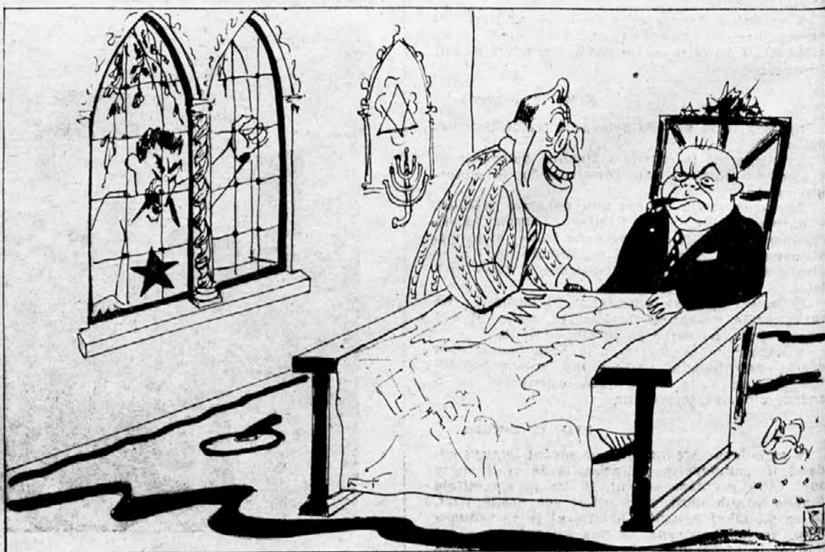
Sodelovanje. Stalin se jezi, ker hoče imeti tretjo fronto. Pa dobro, dajmo mu Severni pol.

KAIRO — Mnogo egipčanov je bilo zaprtih ker so izrazili svoje protiangleško mišljenje.