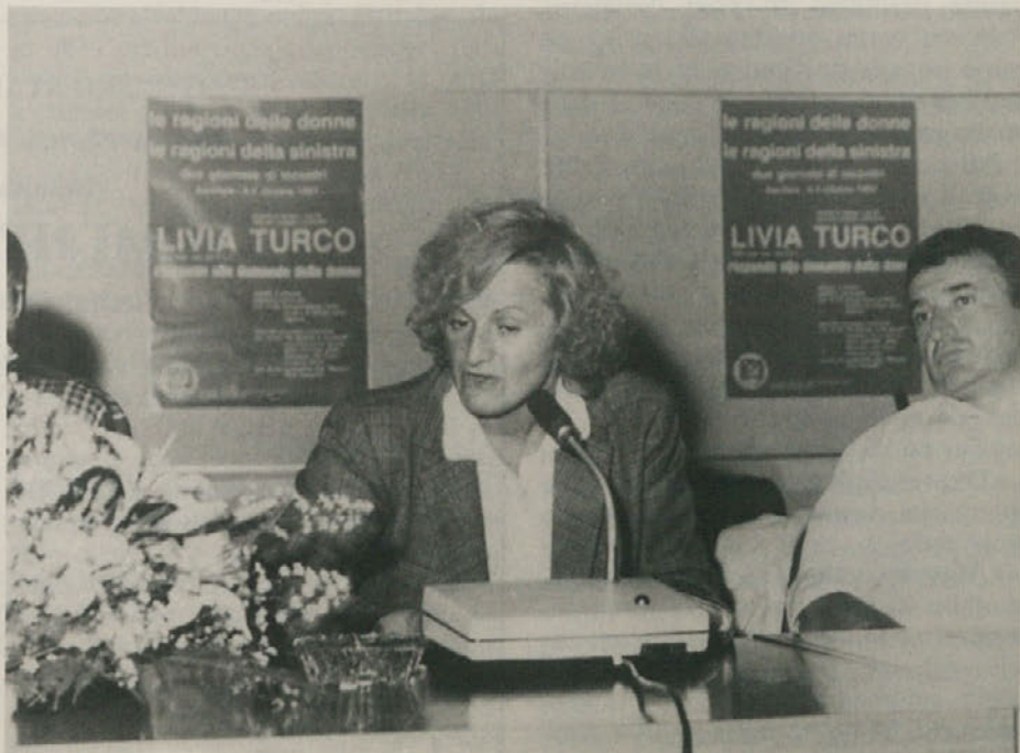
Dne 2. oktobra je bilo v Ogleju srečanje s tovarišico Livio Turco.

«Popolnoma prostovoljno ste se umaknili. Toda morda to ni bila le Vaša plemenitost, nemara ste bili že malo utrujeni. Imeli pa ste tudi skrivno strast: želeli ste si mirnega pisanja v vaši Boisserie. Del Vaše osebnosti je ostal vojaški. Sinova ste poslali na vojaške akademije, niti na misel Vam ni prišlo, da bi ju uvajali v politiko. Tuj Vam je bil nepotizem, čeprav je res, da ste se pogosto približali taki stopnji nedopovedljivosti, ki je bila že blizu absolutizmu. Francija prav po Vaši zaslugi ni nikoli