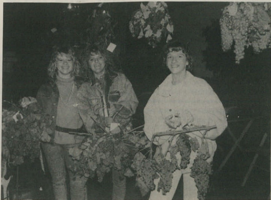
V Lonjerju je bil praznik grozdja.

Bitka za spremembo finančnega zakona se šele pričinja, vendar moramo poudariti, da bo neuspešna, če za parlamentarnim bojem ne bo čutiti širšega pritiska. Zato upamo, da bo pri vseh prevladal čut odgovornosti in da bo na-