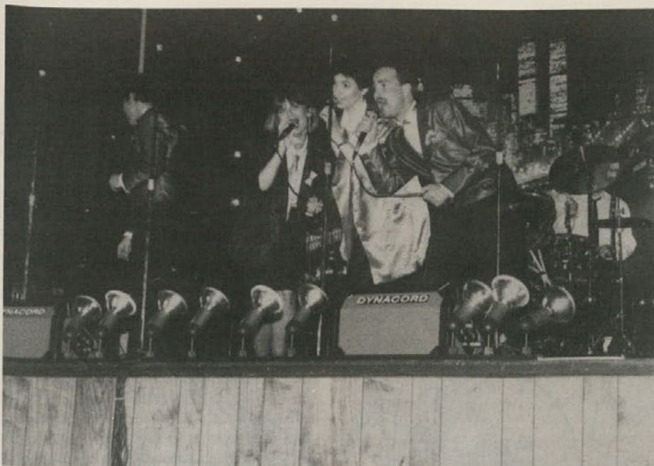
V petek 2. oktobra je v občinskem gledališču v Boljuncu nastopila namška glasbena skupina Swingin' Fast-food. Večer je priredilo kulturno društvo Valentin Vodnik.

žiriji. Heksagona je med drugo vojno izgubila razmeroma malo ljudi. Toda v Vietnamu je po nepotrebnem prelila neizmerne količine krvi. Popolnoma nepotrebne smrti!