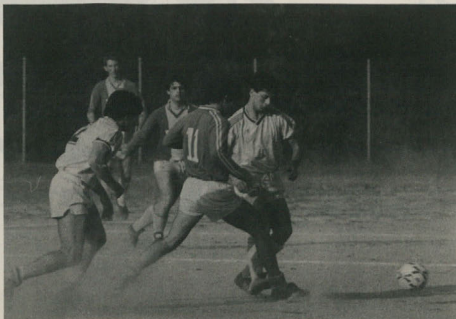
Začelo se je prvenstvo tretje amaterske lige. Posnetek s tekme Gaja-Romana.

«Potem se je Francija vojaško želela oprati, bojevala se je v Vietnamu in Al-