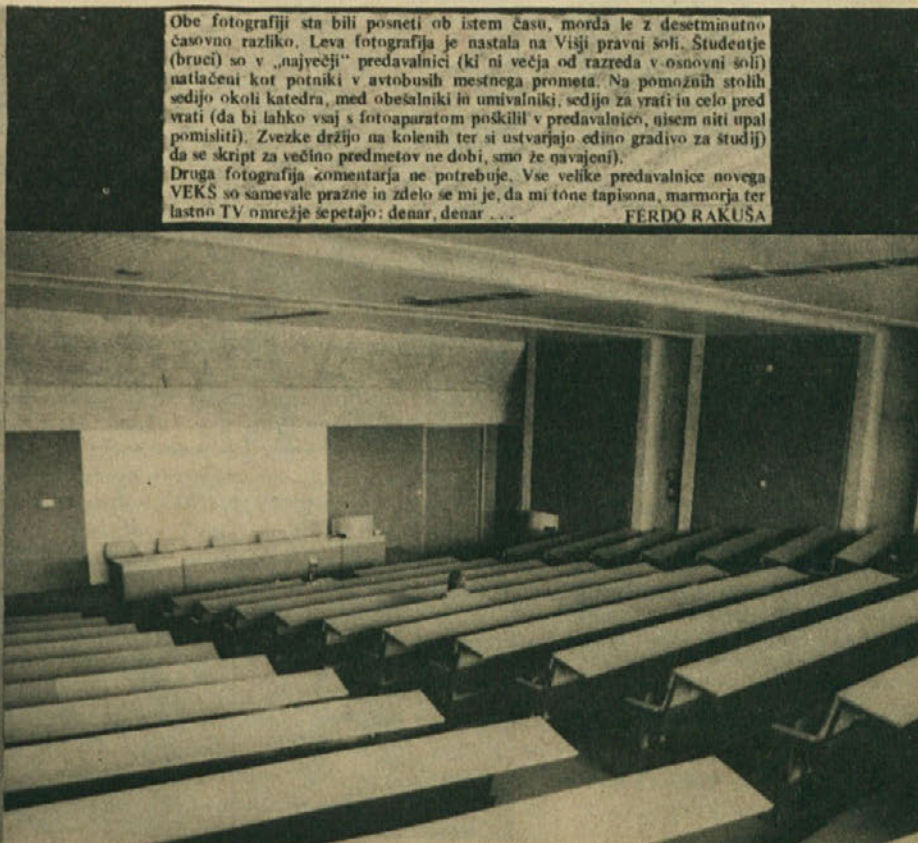
Obe fotografiji sta bili posneti ob istem času, morda le z desetminutno časovno razliko. Leva fotografija je nastala na Višji pravni šoli. Studentje (bruci) so v „največji“ predavalnici (ki ni večja od razreda v osnovni šoli) natlačeni kot potniki v avtobusih mestnega prometa. Na pomožnih stoli sedijo okoli katedra, med obešalniki in umivalniki, sedijo za vrati in celo pred vrati (da bi lahko vsaj s fotoaparatom poškilili v predavalnico, nistem niti upal pomisliti). Zvezke držijo na kolenih ter si ustvarjajo edino gradivo za študij (da se skript za večino predmetov ne dobi, smo že navajeni). Druga fotografija zomentarja ne potrebuje. Vse velike predavalnice novega VEKS so samevale prazne in zleto se mi je, da mi tone tapisona, marmorja ter lastno TV omrežje sepetajo: denar, denar ... FERDO RAKUŠA