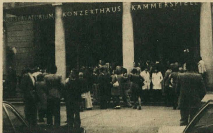
Udeleženci protestnega zbora pred dvorano v Celovcu

Sedaj je jasno, da od avstrijske države, od njenih strank in vlade, ki so vsi nacionalistično pobarvani, ne morejo pričakovati ničesar več. Avstrija je 20 let od pospisa državne pogodbe samo lagala in ji zato ni mogoče več zaupati. Seveda pa se Koroški Slovenci ne bodo pustili prešteti! Na protestnem zborovanju, ki sta ga v Celovcu sklicali Zveza slovenskih organizacij in Narodni svet koroških Slovencev, so to dovolj glasno povedali. V njih je še vedno dovolj življenjskih moči. Za svoje najosnovnejše pravice se bodo borili z vsemi sredstvi in tako dolgo, dokler jih ne bodo dosegli. Prišel je čas, da se še bolj oprejo na lastne sile, hkrati pa storijo vse za INTERNACIONALIZACIJO, to je prenos koroškega vprašanja preko avstrijskih meja. Pri tem upravičeno računajo na