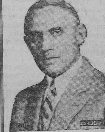
Walter J. Kohler