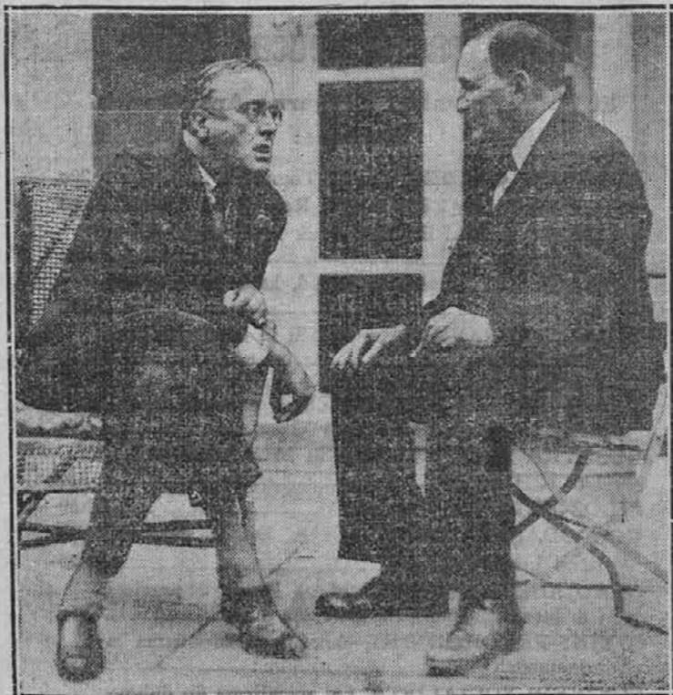
Tu vidimo demokratskega senatorja J. Robinsona iz Arkansasa, ko je nedavno obiskal gov. Roosevelta v njegovem domu v Hyde Park, N. Y. Robinson je bil demokratski predsedniški kandidat leta 1928.