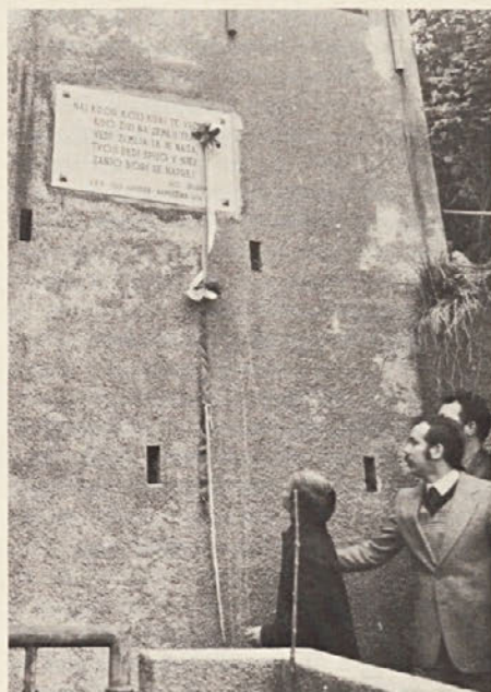
V nabrežinskem bregu so vzdali ploščo, v katero so vklesani naslednji verzi Iga Grudna: Naj kdor koli kaj te vpraša / kdo živi na zemlji tej / vedi, zemlja ta je naša / tvoji dedi spijo v njej / zanjo bori se naprej. Ploščo je postavilo SPD Igo Gruden - Nabrežina

Bistveno vprašanje je tudi odprtje slovenske šole povsod, kjer strnjeno živijo Slovenci in to je v Beneški Sloveniji"