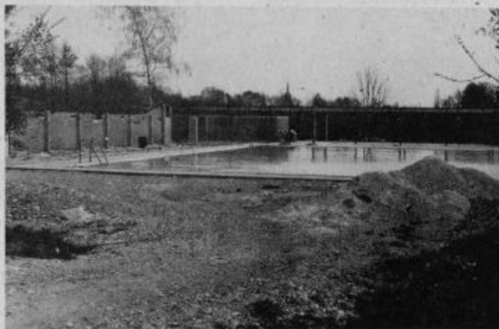
Podoba bistriškega bazena pred dnevi — z malo upanja v uspeh!

Prepričani so, da se bo spremeni na bolje, morda prav sedaj, ko tudi v vodstvu naredijo spremembe zaradi nesoglasij, ki pa niso imenovane vpliva na delo odreda. Zelo je le, da bi se spet vsi člani aktivno vključili v akcije taborniškega odreda „BORIS KIDRIČ“ Kidričevem.