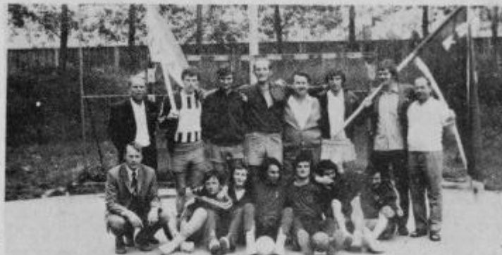
Igralci in vodstvo RK „DRAVA“