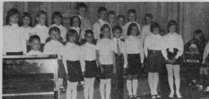
Pevski zbor glasbene šole Slov. Bistrica