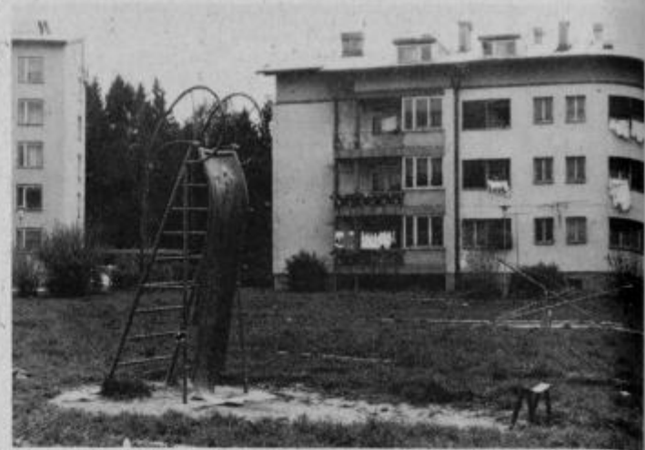
Takšnemu toboganu ni zaupati, zato je tudi zatišje okrog njega in tudi vseh ostalih rekvizitov za zabavo in igro najmlajših

Med takšne redne goste sodita tudi dve ptujski športni društvi, ki sta pred tem zahajali na Pohorje ali na Borl, sedaj pa oboji ugotavljajo, da je najboljša in najceneje na Štatenbergu.“