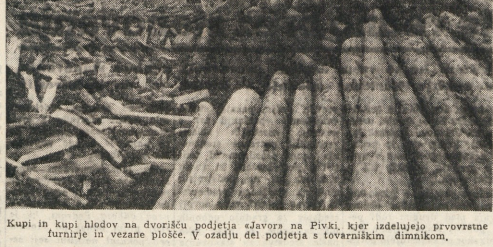
Kupi in kupi hlovdov na dvorišču podjetja «Javor» na Pivki, kjer izdelujejo prvovrstne furnirje in vezane plošče. V ozadju del podjetja s tovarniškimi dimnikovi.