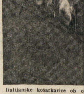
Italijanske košarkarice ob odhodu iz Trsta v Beograd.

Češki napad slab DUNAJ, 5. — Češkoslovaška reprezentanca je včeraj igrala z izbranim moštvom