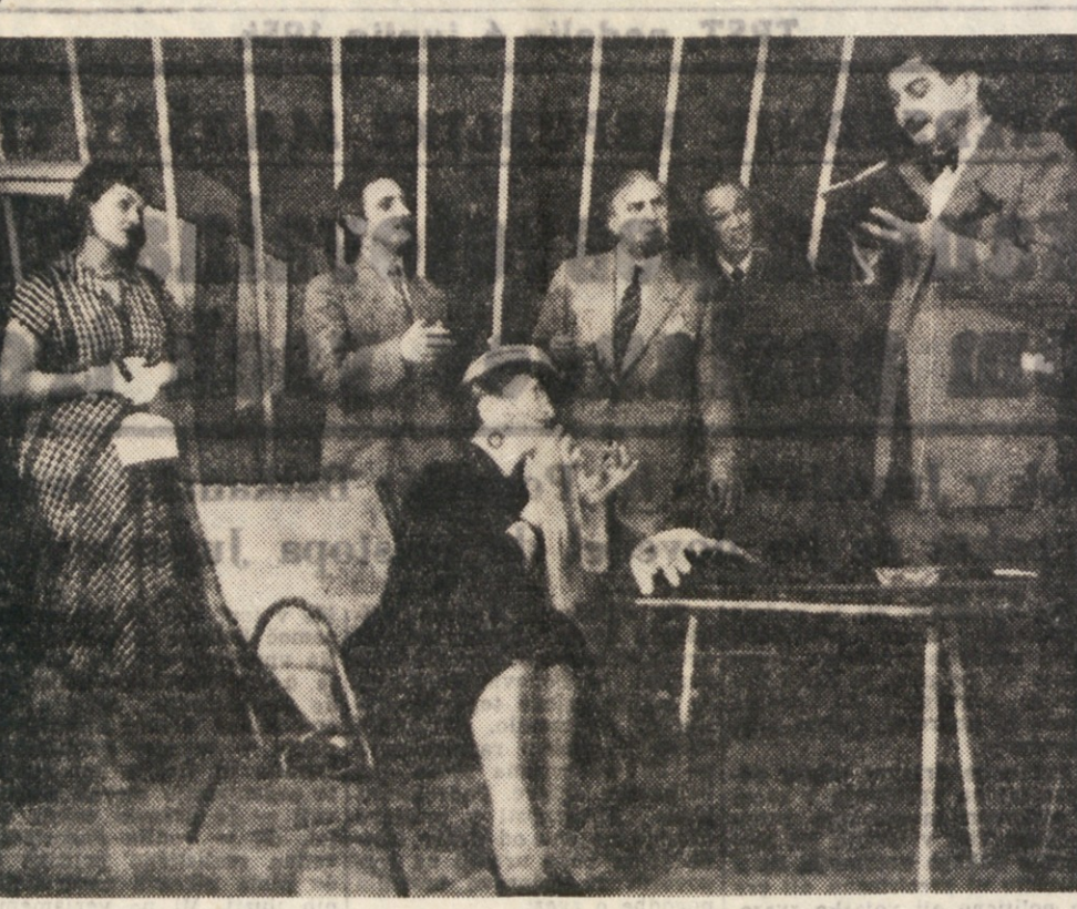
Danes 6. in jutri 7. t. m. bo v NABREZINI v kulturnem domu selgo Grudena razstava slovenske knjige ki bo odprta od 9. do 13. in od 14. do 20. ure.