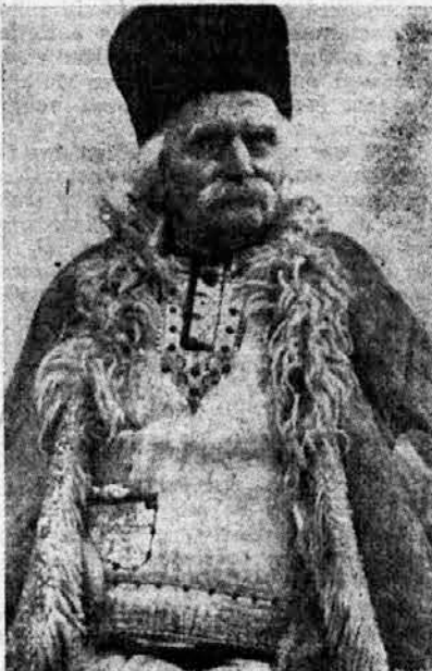
Kmet iz romunske Transilvanije.

dviga svoje latinsko čelo, Vam pošilja romunski narod izjavo svoje zvestobe in upanja v Italijanski narod in njegovega velikega duceja. In spet stojimo na mejniku nove etape v mrzličnem razvoju Evrope, razvoju, ki se je začel januarja 1933. s Hitlerjevimi prihodom na oblast. Karol II. je bil vladar številčno precej velike države; saj je štela Velika Romunija, ustvarjena leta 1919. v Versaillesu, 19 milijonov ljudi. Zal je bila versajska Romunija močna in velika le toliko, kolikor je imela močnih in velikih zaveznikov in prijateljev. Razen Jugoslavije in bivše Poljske so namreč ta latinski otok na meji med Srednjo, Vzhodno in Balkansko Evropo obdajale same neprijateljske sosesde: Ogrska, Sovjetska Rusija, Bolgarija. Sosesde, ki so vse imele stare račune z njo. Najhujšo nasprotnico je Romunija videla vseh teh 22 let po končani