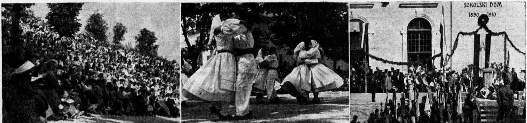
V nedeljo 8. t. m. se je v Metliki vršil ob udeležbi 5.000 ljudi veliki belokranjski narodni festival. Na prvi sliki vidimo del množice, ki prisostvuje festivalu, druga slika pa kaže enega izmed mnogih narodnih plesov, ki smo jih občudovali na veličastni prireditvi. — Isto nedeljo je imelo svoj praznik tudi Zagorje ob Savi: tamkajšnji Sokoli so namreč ob veliki udeležbi občinstva odkrili spomenik kralju Aleksandru I. Zedinitelju. Naša tretja slika kaže prizor s te slovesnosti.