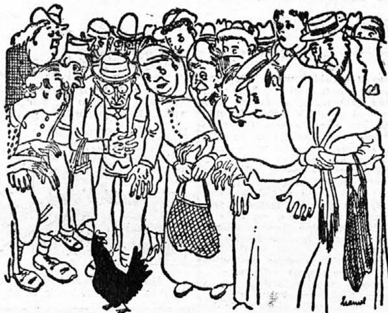
NA FRANCOSKEM PRIMANJKUJE ŽIVEŽA...

Na žalost, pravi pisec, sem moral ugotoviti zelo vznemirljive simptome. Mislim sem, da je nesreča Francijo zedinila; kaj šel Nasprotja, ki so Francoze že pred vojno ločila, še