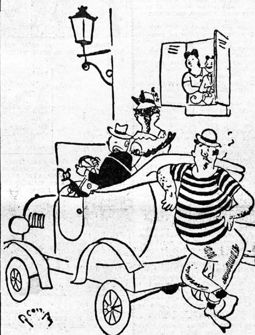
... IN BENCINA

Kura: »Če ne boste nehali prežati name, vam tega jajca sploh ne znesem!« Candide