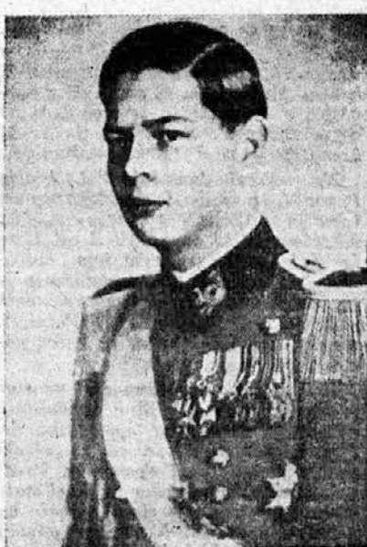
Novi romunski kralj Mihael.

vračali se bodo nad London in nad druga angleška mesta vse dotlej, dokler ne bo legla na Anglijo jesenska megla. * General de Gaulle, zastopnik tretje Francije, t. j. tiste, ki ni hotela kapitulirati, je bil še pred desetimi dnevi nekakšen vladar brez dežele. Razen peščice letalcev in mornariških častnikov se ni njegovemu pozivu na nadaljevanje vojne proti Nemčiji in Italiji odzval skoraj noben Francoz. Konec predzadnjega tedna se je generalu de Gaulle pridružila Čadska kolonija v Centralni Afriki. Nekaj dni nato sta prestopili na njegovo stran tudi francoski afriški koloniji Kamerun in Kongo. Vse te, sicer zelo slabo obljudene posesti francoskega kolonijskega imperija merijo skupaj 2 1/2 milijona kvadratnih kilometrov. Strateški pomen njih pristopa h generalu de Gaulleju je v tem, da meje ob Britansko Nigerijo in ob Sudan. Te dni se širijo glasovi, da se misli tudi Indokina izneveriti vichyjski vladi in se pridružiti de Gaulleju. V luči teh dogodkov je razumljivo, zakaj je vichyjska vlada poslala generala Weyganda v Severno Afriko. Observer