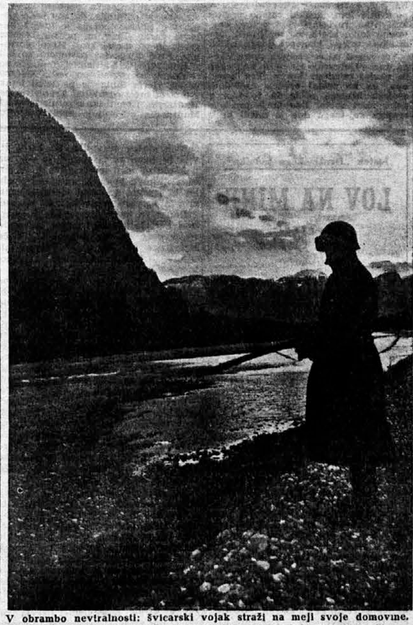
V obrambo nevtralnosti: švicarski vojak straži na meji svoje domovine.

vračali se bodo nad London in nad druga angleška mesta vse dotlej, dokler ne bo legla na Anglijo jesenska megla. * General de Gaulle, zastopnik tretje Francije, t. j. tiste, ki ni hotela kapitulirati, je bil še pred desetimi dnevi nekakšen vladar brez dežele. Razen peščice letalcev in mornariških častnikov se ni njegovemu pozivu na nadaljevanje vojne proti Nemčiji in Italiji odzval skoraj noben Francoz. Konec predzadnjega tedna se je generalu de Gaulle pridružila Čadska kolonija v Centralni Afriki. Nekaj dni nato sta prestopili na njegovo stran tudi francoski afriški koloniji Kamerun in Kongo. Vse te, sicer zelo slabo obljudene posesti francoskega kolonijskega imperija merijo skupaj 2 1/2 milijona kvadratnih kilometrov. Strateški pomen njih pristopa h generalu de Gaulleju je v tem, da meje ob Britansko Nigerijo in ob Sudan. Te dni se širijo glasovi, da se misli tudi Indokina izneveriti vichyjski vladi in se pridružiti de Gaulleju. V luči teh dogodkov je razumljivo, zakaj je vichyjska vlada poslala generala Weyganda v Severno Afriko. Observer