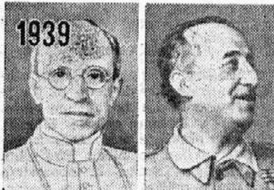
Pij XII. Franco

Smrt papeža Pija XI.; njegov naslednik postane pod imenom Pija XII. kardinal Pacelli. Nemčija zasede Klajpedo (Memel), Italija pa Albanijo.