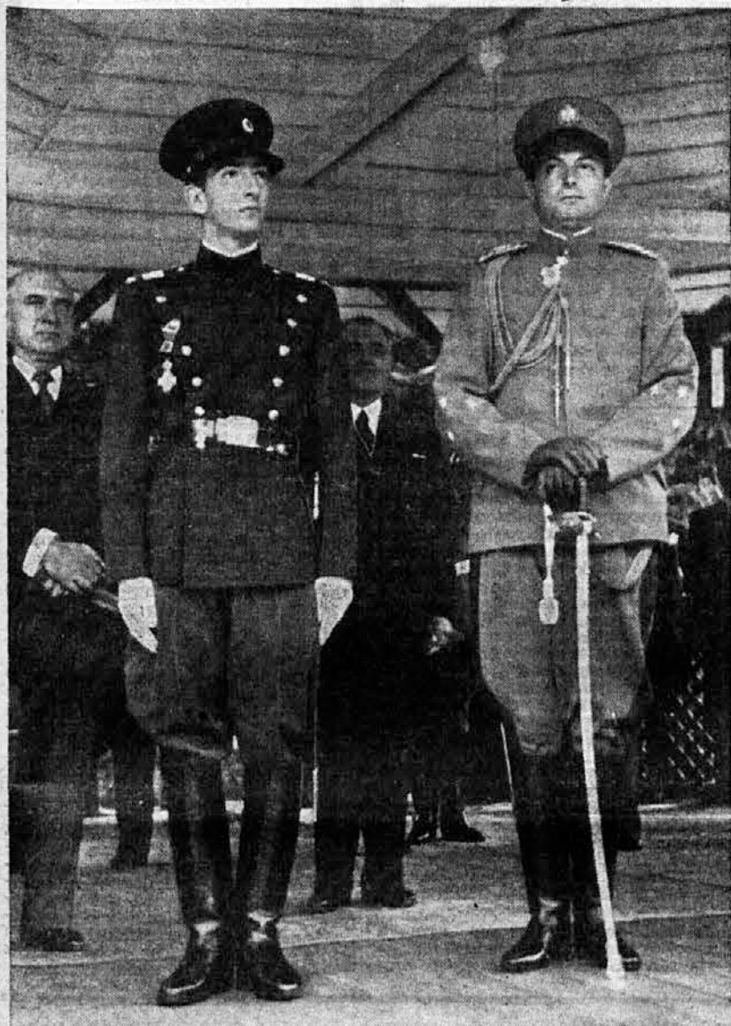
K rojstnemu dnevu Nj. Vel. kralja Petra II.: slika vladarja in Nj. Vis. kneza namestnika Pavla s slave konjeniške brigade kr. garde v Beogradu.

Romunski kralj Karol II. je moral odstopiti, — Vichyjska vlada izgublja kolonije