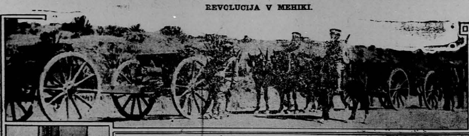
REVOLUCIJA V MEHIKI.

Bogota, Colombia, 20. decembra. Sem so dospela poročila, da se je pojavil strahovit potres na meji med Ecuadorom in Colombijo. Štiri mesta so baje popolnoma uničena. Življenje je izgubilo 30.000 oseb, 23.000 ljudi je brez strehe. V bližini Tilcana je počila zemljiska površina. V razpoko je steklo veliko jezero Las Grandas.