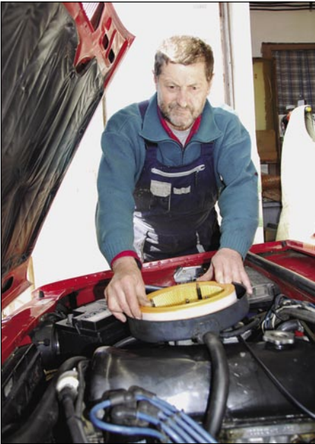
Djauži Kosar, pd. Bazar pravi, ka so lade, wartburgi, dačie nej tak lagvi avtogne bili

Gnesden, gda je telko avtonov v Porabji, ka bi z njimi Rabo leko stavo, bi človek tak mislo, ka vsigdar več avtomehanikov baude, šteri autone popravljajo. Dapa tau je nej tak, od leta do leta je menje tisti, šteri se k taumi razmejo