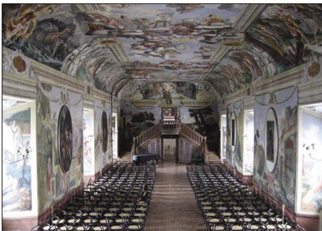
Viteška dvorana v Brežicaj

pa Rovačko, ali če škemo djenau povōdati, med Avstrijo pa Vogrsko.