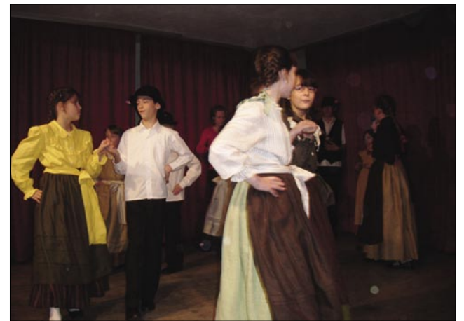
Mlašeča folklor iz Števanovec je prvič gorstaupila v nauvi gvantaj, nastop je bijo obenem generalka za revijo otroških folklornih skupin