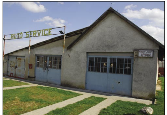
V delavnici zdaj dela več samo sam, gnauksvejta je emo inaše tō

»Človek, gda je starejše avtone popravilo, je vekšo radost emo, da je eden motor vküps-