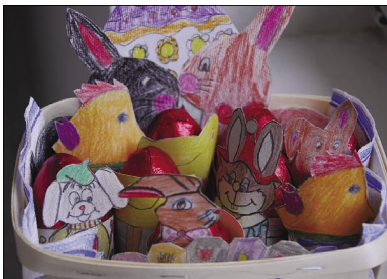
Darilca, ki so jih pripravili gornjeseniški učenci za kroške prijatelje za veliko noč

Tako učenci kot učiteljice na obeh straneh ustvarjalno sodelujejo. Preko pisemc in likovne govornice se je spletlo iskreno prijateljstvo, ki bo kmalu okronano z osebnim spoznavanjem udeležencev. Že v aprilu bodo sodelujoči iz POŠ Krog obiskali in v živo spoznali porabske prijatelje, konec maja pa bodo porabski učenci in učiteljice gostje POŠ Krog. Upajmo, da bosta sodelujoči strani začetek lepega in uspešnega partnerstva nadaljevali ter nadgrajevali tudi v prihodnjem šolskem letu, saj gre za aktivno poživitev šolskega vsakdana, na porabskih šolah pa tudi za priložnost kaj lepega povedati ali zapisati po slovensko.