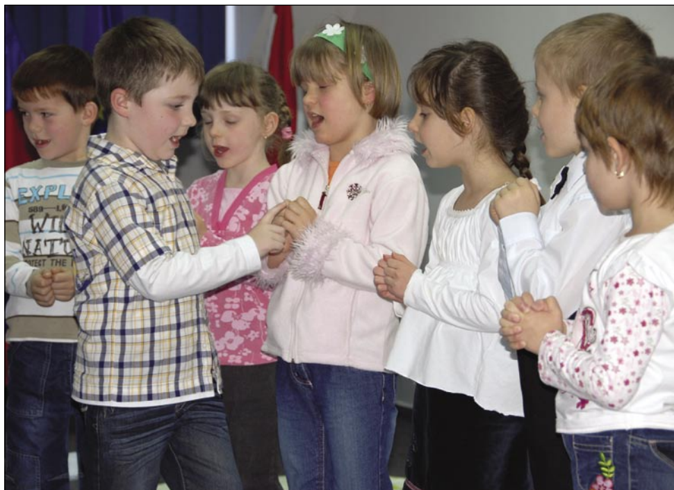
Malčki iz vrtca Monošter-Slovenska ves