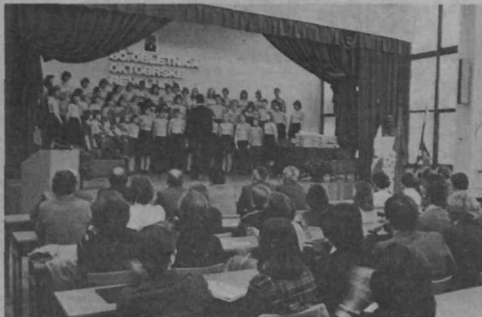
SPREJEM V ZK — Pred dnevom republike je bila v Druženem domu Stadion zaključna prireditev v okviru proslavljanja 60. obletnice oktobrske revolucije, hkrati pa so 103 mladince iz organizacij združenega dela, krajevnih skupnosti in šol sprejeli v Zvezo komunistov. Podelili so tudi 8 knjižnih nagrad učencem osnovnih šol za spise na temo: Revolucija, ki je spremenila življenje milijonov ljudi.