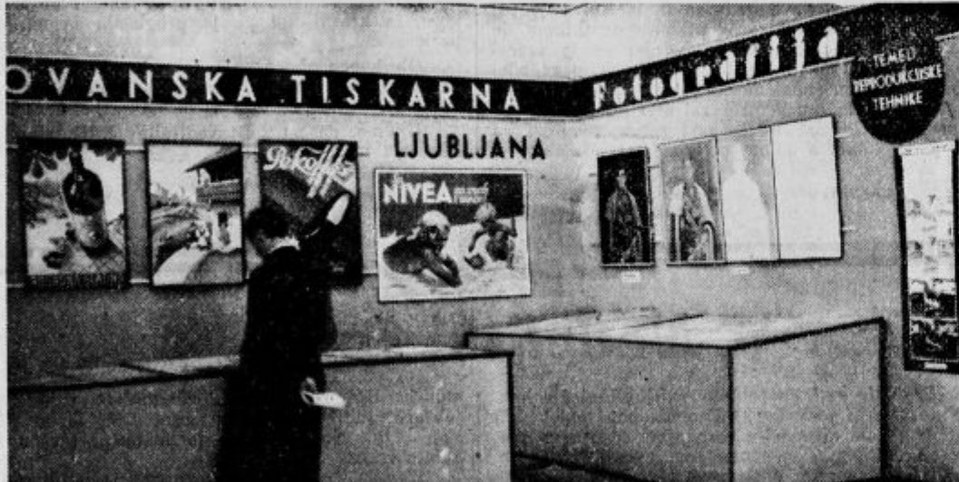
Pogled v oddelek Jugoslovanske tiskarne na fotografski razstavi na velesojmu. — Gledalec se je ustavil prav pred zgledi kopij barvnih fotografij zdravilišča v Rimskih toplicah.

Jasne in nad vse umestne besede g. bana so vsi navzoči pozdravili z dolgotrajnim, viharnim odobravanjem v dokaz, da je izrazil misel, ki je vsem katoliškim Slovincem najbolj pri srcu. Nato so si otroci in njih starši ogledali nove šolske prostore, ki bodo za bodoča desetletja torišče ljudske izobrazbe črnuške srenje.