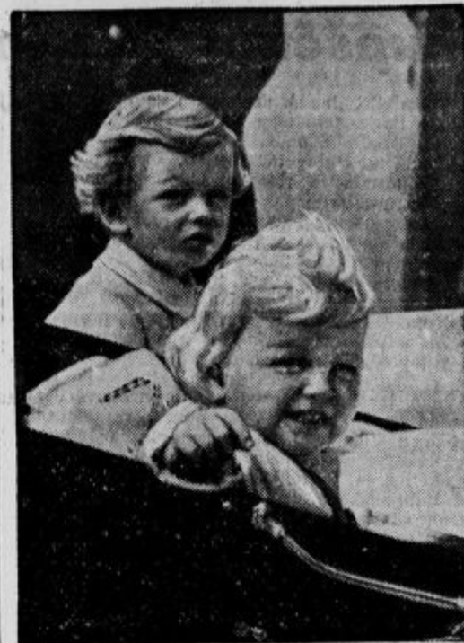
Prine in princeska v otroškem vozičku Prine Edvard in princeska Aleksandra, otroka kentskega vojvodskega para, na sprehodu.

Po dolgih letih mirnega zakonskega življenja je »kralj krotilcev zverin« spokojno umrl, ko se je bil nekoč sredi poletja močno prehladil.