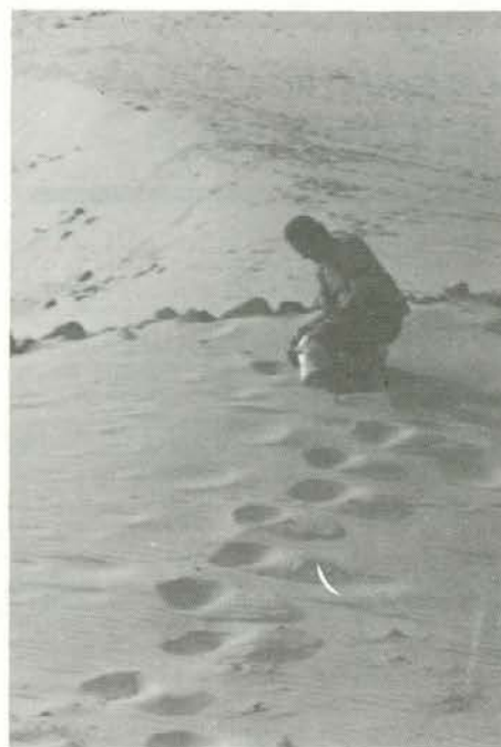
Še malo peska za spomin.

Po vrnitvi v Kairo, smo čakali na nočni let v domovino, kar je še posebej veselilo mojo ženo, saj je vse dneve preživela le ob vodi, čaju in sadju, ki se je dalo olupiti. Tek je izgubila že prvi dan, ko je opazila strežnika, kako briše jedilni pribor v svojo umazano haljo in ga polaga na mizo, za katero smo nato sedli k večerji. Post ji ni škodil, zaslužila si ga pa ni, saj mi je prav ona omogočila izpolnitev te dolgoletne in velike želje. V jutranjih urah smo se poslovili od prestolnice Egipta in poleteli domov. Pod nami so se v prosojnem soncu