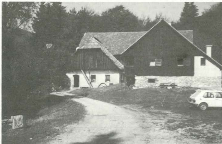
Starodavna domačija »Vernarca« pod Uršljo goro, zavetišče gozdarjev in planincev.