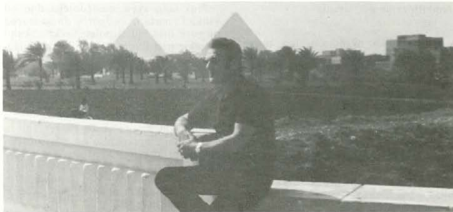
Pogled na piramide od druge strani.

Po tretjem dnevu, prebitem v Kairu, smo vstopili na vlak, ki nas je popeljal na 1000 km dolgo pot do Asuana. Tu je elektrarna, ki daje dovolj elektrike za vso deželo. Ta vodna pregrada je tudi kriva, da se že čutijo spremembe podnebja. Nil ne poplavlja, s tem pa ne prinaša več gnojil in rudnin v nižje predele Egipta, kar se v kmetijstvu močno pozna, saj morajo tisočletja rodovitno zemljo sedaj že umetno gnojiti. Skozi okno vagona sem zrl bežečo pokrajino pred seboj in žaloval za nekdanjo idilo, ki sem se je spominjal. Ko sem z vojaškega kamiona opazoval pokrajino ob delti Nila ob prvem srečanju s kmetijstvom te dežele, sem res užival. Ob kana-