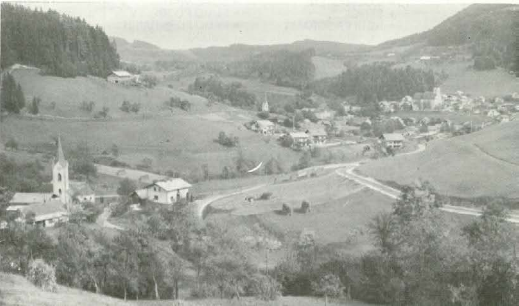
Takšen je pogled iz Brezna proti Vitanju. Asfaltna vijugasta cesta je njihov ponos.