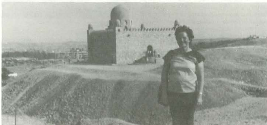
Mavzolej Age Khana (žena je pa moja).