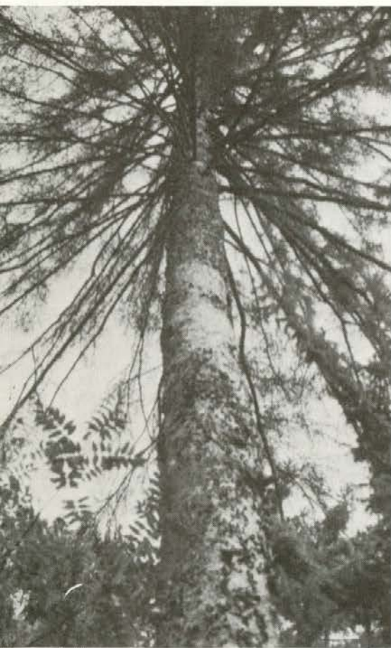
Smrekov lubadar neusmiljeno pustoši naše gozdove