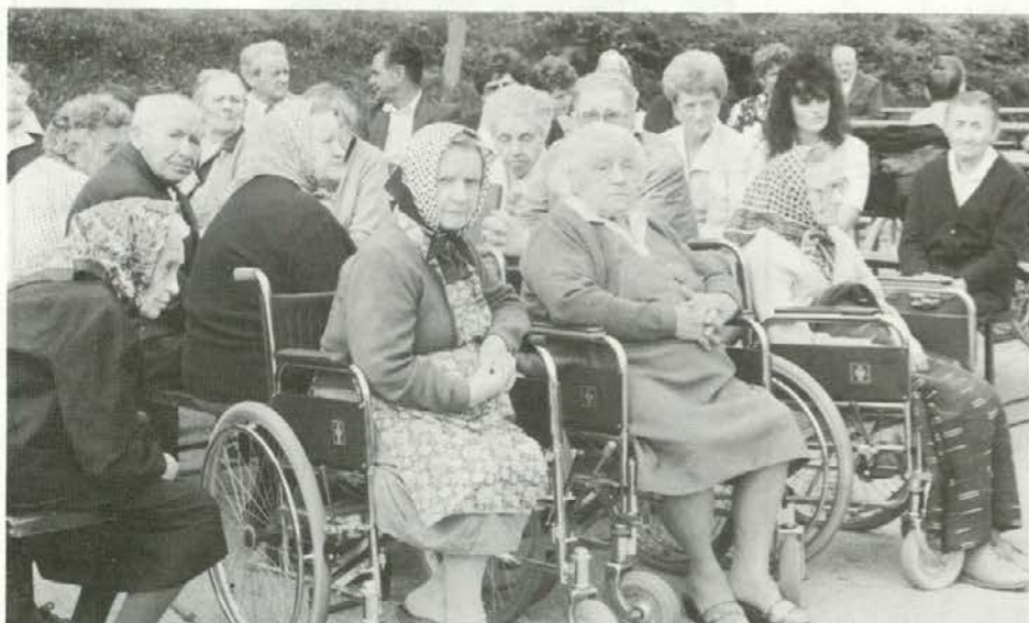
Priveditve v Črnečah so bili gotovo najbolj veseli varovanci doma.