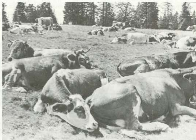
Opoldanski počitek živine na Rogli

Glasilu VIHARNIK izdaja delovna organizacija Gozdno gospodarstvo Slovenj Gradec. Urednica: Ida ROBNIK, lektorica: Majda KLEMENŠEK, tehnični urednik: Bruno ŽNIDERŠIČ.