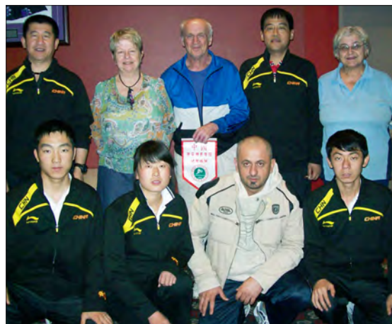
Kitajska mladinska balinarska reprezentanca s trenerji na obisku v Klubu Triglav.