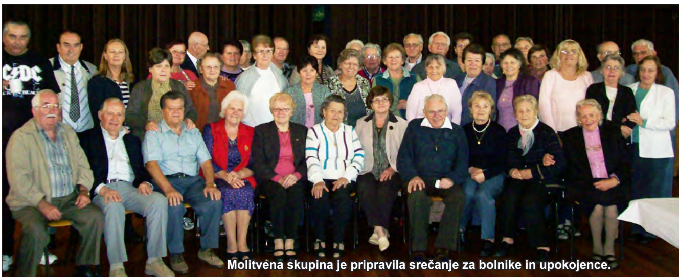
Molitvena skupina je pripravila srečanje za bolnike in upokojece.