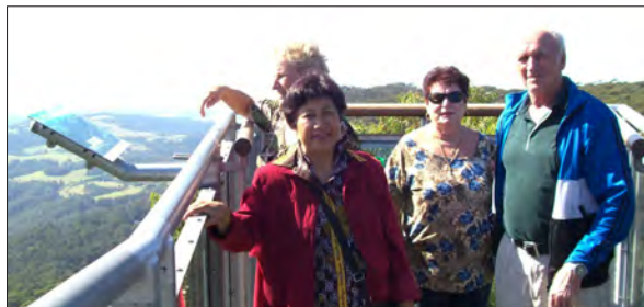
Pogled z razglednega hodnika.

V mesecu aprilu smo obiskali Illawarra Fly Tree Top Walk blizu Nowre na Južni obali. Sprehajali smo se po zapletenih hodnikih nad vrhovi dreves in kadar je jasen dan, se vidi morje na eno stran in Sydney na drugi strani. Korenjaki, ki so zmogli skoraj sto stopnic v razglednem stolpu, pa so videli še bolj daleč. Po kosilu v klubu v Nowri smo obiskali majhno trgovinsko središče v Robertsonu, ki nosi ime "Cheese factory", ima pa na razpolago poleg številnih vrst sira tudi domači kruh, marmelade, omake, sladolede, zraven pa še ročna dela; na vsak način zanimiva in ogleda vredna trgovina.