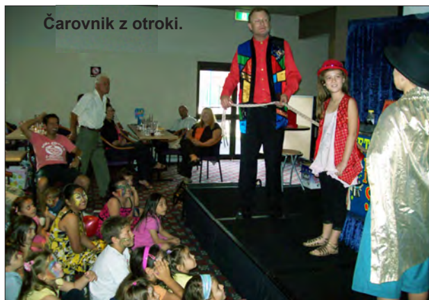
Čarovnik z otroki.

Vsako drugo nedeljo v mesecu imamo v Klubu Triglav družinski dan, ko se zbere v klubu veliko število otrok. Ograjeno dvorišče kluba z otroškim igriščem ima dovolj prostora za BBQ za otroke, gumijasti grad, umetnico, ki poslika obraze otrok s cvetjem in živalskimi obrazy, v dvorani jih zabava čarovnik, starši pa so tako že navajeni na navdušene otroške glasove, ki včasih napravijo vtis, da bodo dvignili streho.