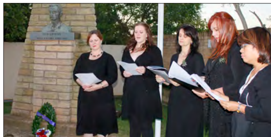
Južne zvezde pred Cankarjevim spomenikom.