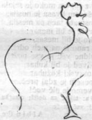
Nariši v eni potezi.

Drenov Jernejče je res storil tako in se je prepričal, da ga je bil Tinček naučil prav. Molčal je pa kakor grob, samo meni je siromak razodel to skrivnost. No, jaz sem pa tako klepetav, da sem za vesele praznike še vam izdal to skrivnost. Ivan Albreht.