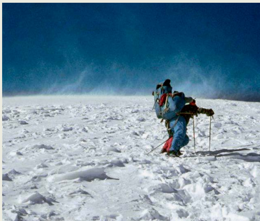
Na vihnem grebenu proti vrhu Pik Lenina

Ante je bil med drugim zadolžen za pripravo gradiva za izvajanje obvezne planinske in plezalne tehnike za vojake bataljona. K izdelavi učbenika oz. praktikuma Uputa u vojno planinarstvo je aktivno pristopil, začel pisati besedila, risati planinsko opremo, vozle, načine plezanja itd., pri čemer smo mu seveda vsi pomagali.