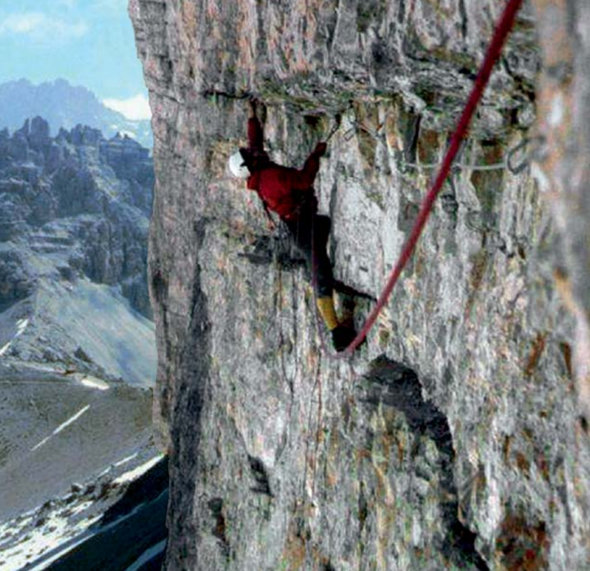
V previsih severne stene zahodne Cine

Črnogorsko vojaško služenje se je za Anteja končalo, ko je odšel na "zaključek" služenja v Slovenijo, v Julijske Alpe. Redno služenje vojaškega roka je sklenil leta 1965 s prvenstveno smerjo v severozahodni steni Male Tičarice z vodniki JLA. Smer je bila ocenjena tudi z -VI.