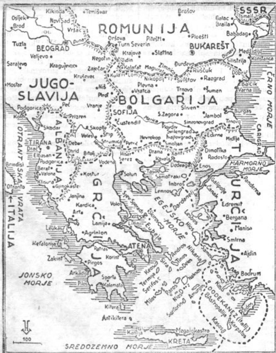
Balkan, prizorišče diplomatskih akcij in vojnih priprav

Francoski konvoj se je umaknil v alžirsko luko Nemurs. Nazaj grede so angleške ladje doživele dva napada s strani francoskih bombnikov, vendar baje ni bilo ne žrtev ne škode.