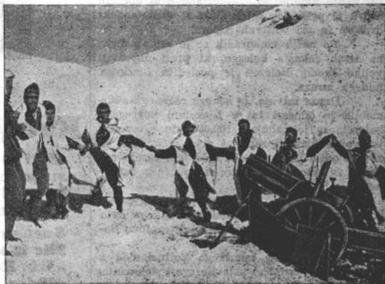
Grški vojaki plešejo kolo kar okrog topa

V Evropo je prvič prišel kavčuk leta 1740. Prinesel ga je neki Francoz La Condanine. Nikdo ni vedel, čemu naj kavčuk služi. Prvič so pričeli uporabljati kavčuk v koristne svrhe