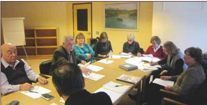
CSHS board members meet on the second Saturday of each month in the Archives, in the lower level of Dom Lipa

Upajmo, da bomo še naprej uspešno uresničevali naše cilje.