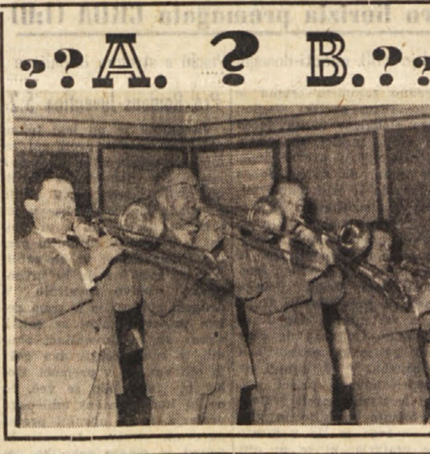
??A. ? B.??

Pod naslovom »Ženska ekspedicija na Himalaje« je Zagrebški »Večnik« objavil pred dvema tednoma vest o angleški ženski ekspediciji, ki jo vodi na Himalaje Joyce Duntheath.