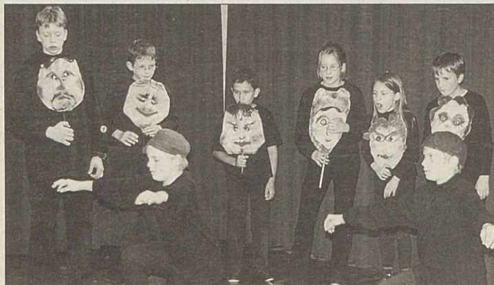
Druga šentjanška gledališka skupina se je poskusila v priredbi Andersenove pravljice.