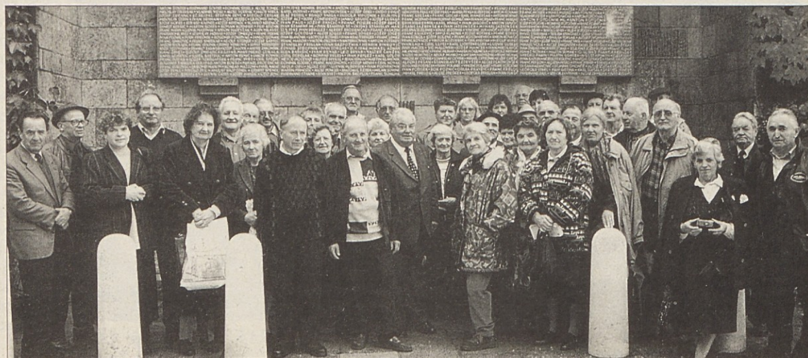
Udeleženci izleta Zveze koroških partizanov pred spomenikom žrtev nacifašizma v Mariboru.