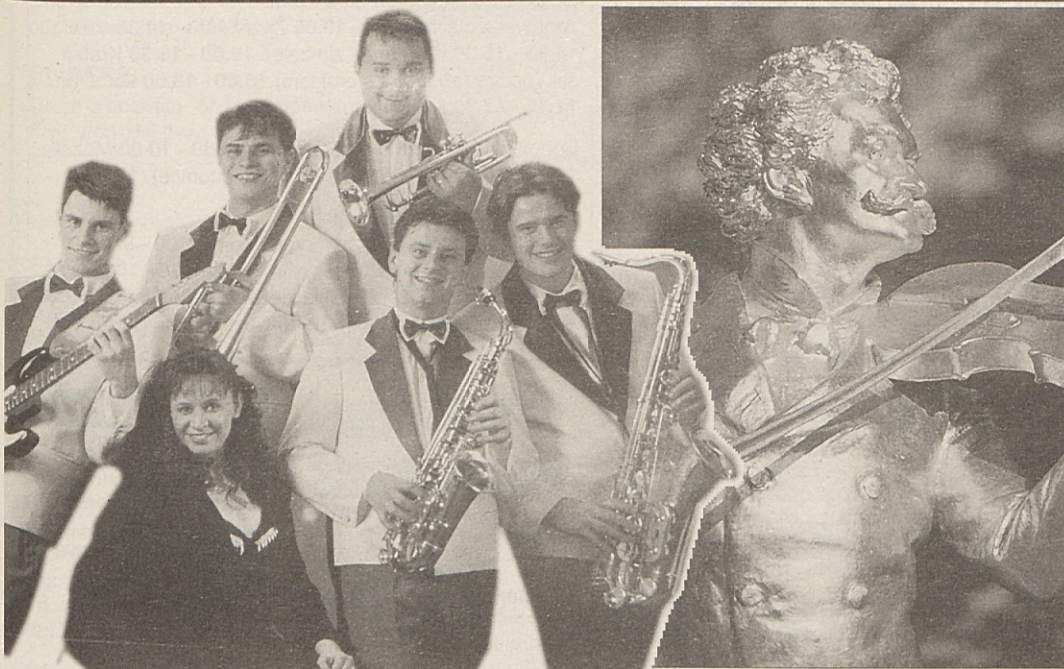
Komponistu Johannu Straußu so letošnji maturantje posvetili svoj maturantski ples. Za sodobne zvoke pa bo skrbel med drugim tudi na Koroškem zelo znani ansambel „Svetlin“ (slika levo).