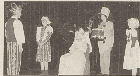
Princeska si je zaželela modro vrtnico.

deva poročiti, toda princesi to ni po volji, saj hoče omožiti tistega moža, ki ji v znak ljubezni prinese modro vrtnico. Čeprav ji prinesejo princi in fanti modre vrtnice, so te le narisane na svilo oz. papir, kar pa mladi princesi ne zadostuje. Po dolgem, že obupanem čakanju, pride fant s piščalko in ji preda modro vrtnico. Na koncu se poročita.