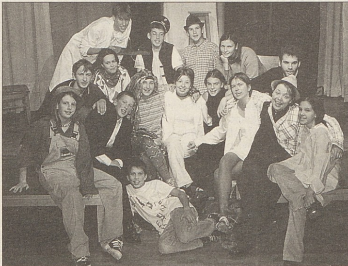
Bilčovški igralci, ki so se uspešno izkazali z dvema predstavama.