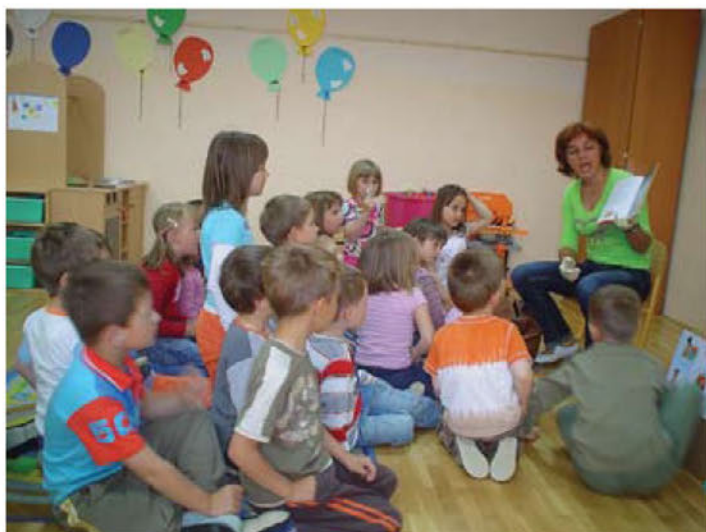
Redni obiski zobozdravnice v vrtcu