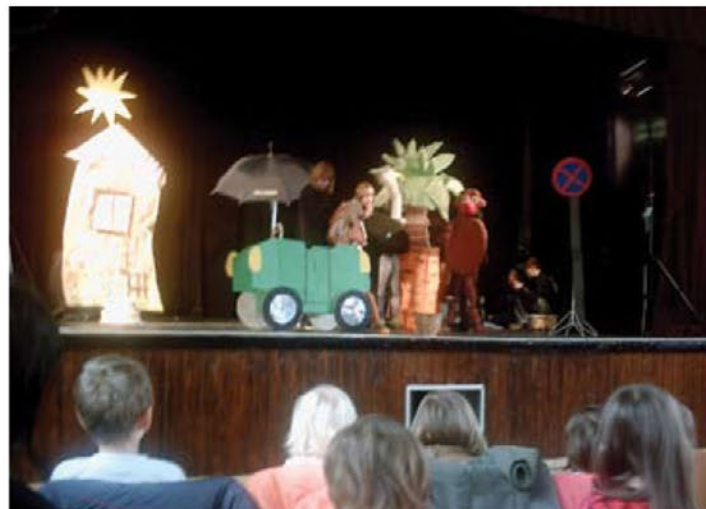
Ogled šolskih gledaliških predstav