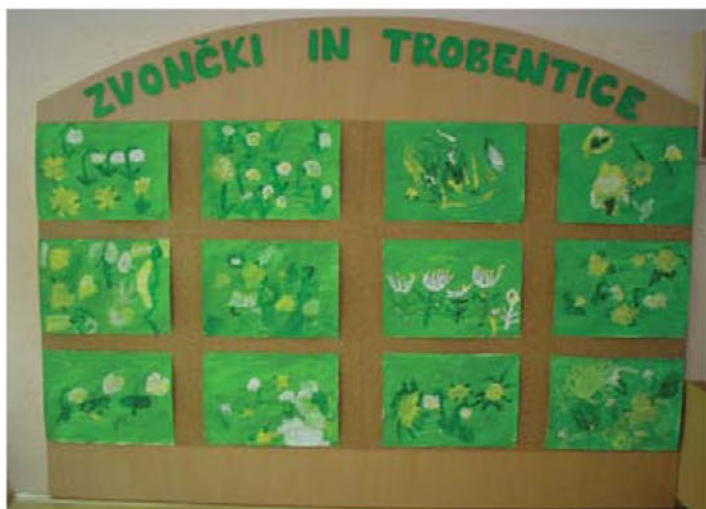
Umetniške dejavnosti otrok na temo pomlad

Pomlad nas je zelo zgodaj prebudila in nekaj njenih utrinkov je prikazanih na fotografijah: