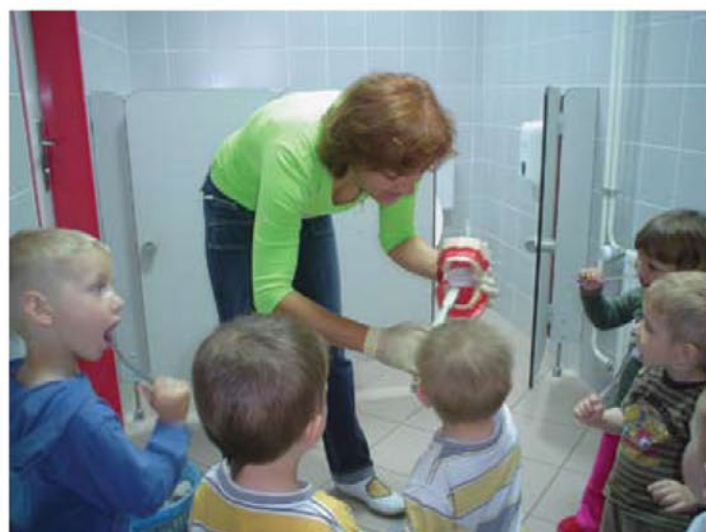
Umivanje zobkov in skrb za higieno