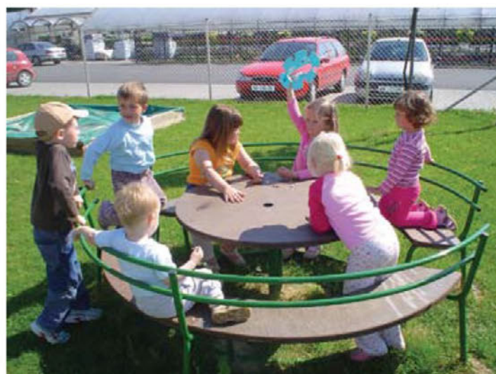
Druženje otrok na vrteškem igrišču