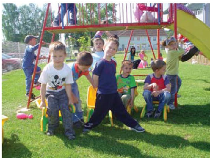
Razvijanje gibalnih sposobnosti na prostem