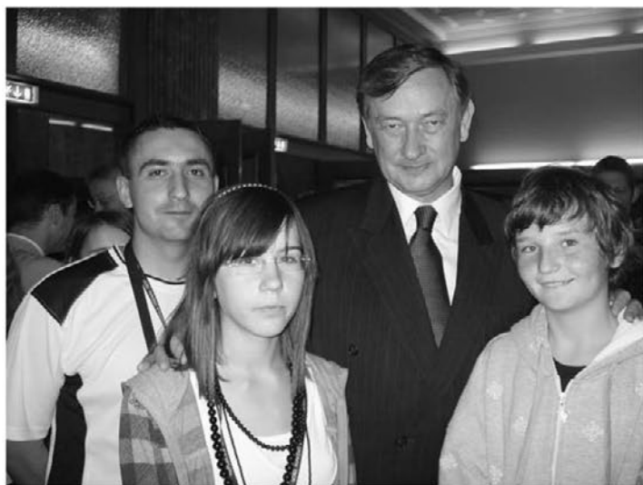
Slikali smo se s predsednikom Slovenije, gospodom Danilom Türkom