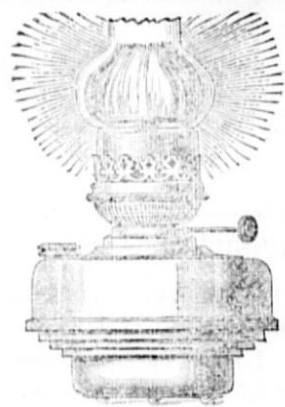
Astralne svetilke ustavek z gorilcem

20" z 58 svečami svetlobne moči 30" s 104 " " " "