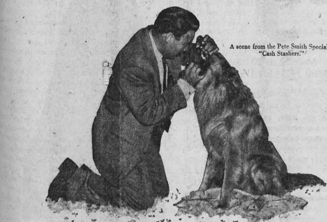
A scene from the Pete Smith Specialty "Cash Stasher."