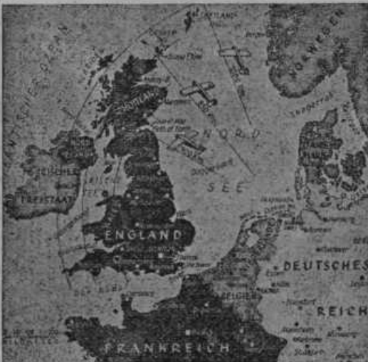
Pregledni zemljevid pokrajin v Severnem morju, katere bombardirajo nemška letala iz svojih oporišč. Anglesko otočje je v letalskem območju Nemčije.