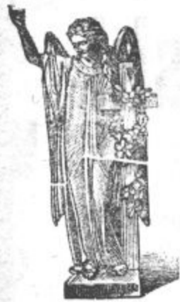
Brzojavi: „Kamnoseška industrijska družba Celje“.