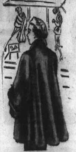
NASA MICKA IMA TUD BESEDO

Na kraj veselih spominov se ljudje radi vračajo. In mi smo bili tiste dni tudi taki. Tretji dan zvečer smo se zopet sestali tamkaj in potem še velikokrat. V soboto 22. oktobra zvečer pa je bil zgodovinski večer za nas