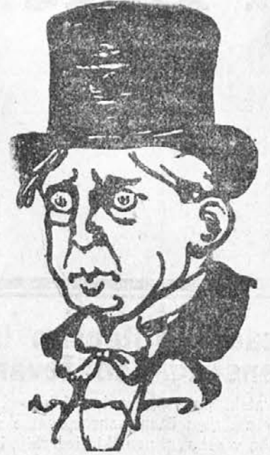
Oktavian Goga, predsednik romunske vlade, ki je podal demisijo.