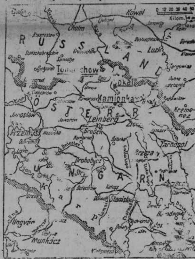
Zemljevid za boje pri Lvovu (Lemberg).

Ko se je naša lvovska armada po bitki pristočno umaknila v okolico Grodeka (zahodno od Lvova) in se tam zbrala, je začela že v ponedeljek, dne 7. septembra pri grodeški glavni cesti, 2 km od Lvova, prodirati (ofenzivo) in s tem začela drugo bitko pri Lvovu. Prodiranje je krasno uspelo. Toda med tem se je pri Lublinu zbrala velikanska množica sovražnih čet, tako, da je bil Dankl prisiljen, se umakniti. Tudi severno krilo Aufferbergove armade, ki je stalo s četami proti jugu, je prišlo v nevarnost. Ta položaj je prisilil vrhovno poveljstvo, da je umaknilo in zbralo vse čete, ker je malodane vsa ruska vojna moč razpostavljena proti nam.