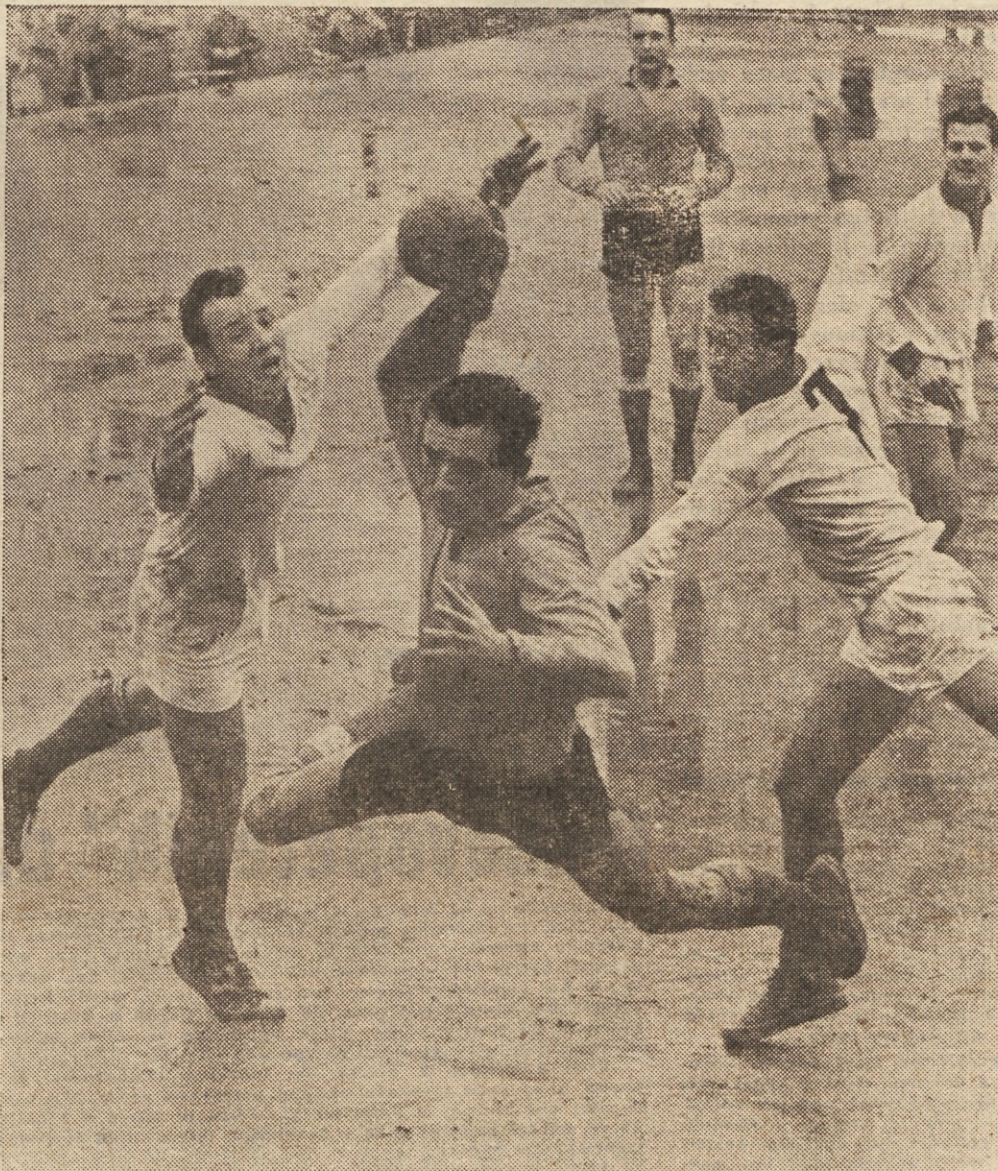
Rokomet je v zelo kratkem času osvojil mladino širom Jugoslavije. Danes ga prav lahko imenujemo najbolj množičen šport pri nas. (Na 2. strani berite: Žoga v rokah mladine)

(F) 201, Majtan (J) 201, Haugland (N) 195, Fournier (F)