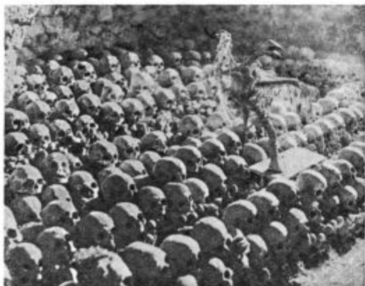
V bratski slogi.

Sam sv. oče Pij XI. je v avdienci 16. julija 1938 z daljšim nagovorom počastil zastopstvo Zveze katoliških dijakov in naš način Katoliške akcije priznal in pohvalil pred vsem svetom. Malo jih je, je dejal papež, pa so dobri, pa so odlično dobri. Prišli so s svojim škofom, tako gorečim za blagor duš. In sv. oče je vedno tako živo želel, da bi v naši deželi videl Katoliško akcijo cveteti, cveteti, da bi prinašala vse sadove, s katerimi jo obogatuje milost in dobrota božja vselej takrat, kadar je Katoliška akcija dobro začeta,