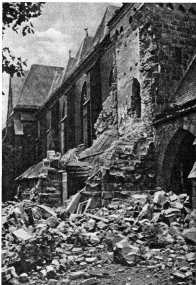
Porušena cerkev N. Lj. Gospe v Hammu. (Zap. bojišče.)

Kristus se je počutil najbolj domačega med najpreprostejšimi in najmanjšimi. Ljubil