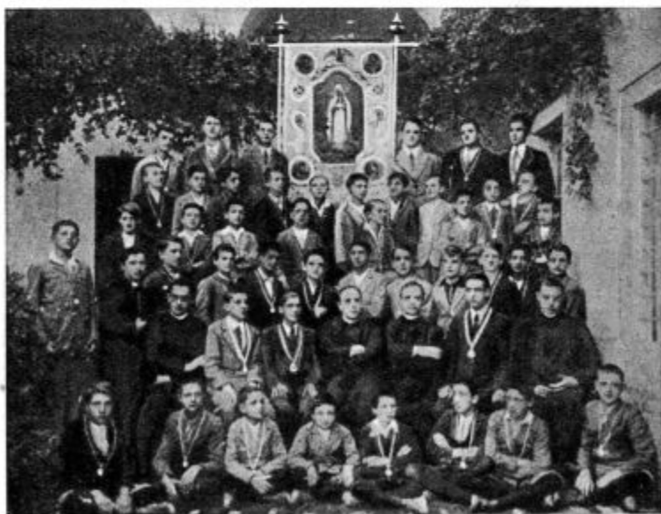
Akademski Marijina družba v Zagrebu. (Glej notico »K našim slikam«.)

Zveza katoliških dijakov hoče izobliko-vati po verskih in nravnih načelih novega dijaka, ki bo resen, značajan, močne volje in čist; požrtvovalen, podjeten in željan plemenitih dejanj. Ta cilj je za mladega človeka nekaj lepega. Vzga-ja se v tistih lastnostih, ki so pogoj za uspeh v življenju in se z njimi more uveljaviti v javnosti ter vplivati na druge, da jim čim bolj pripomore do prave