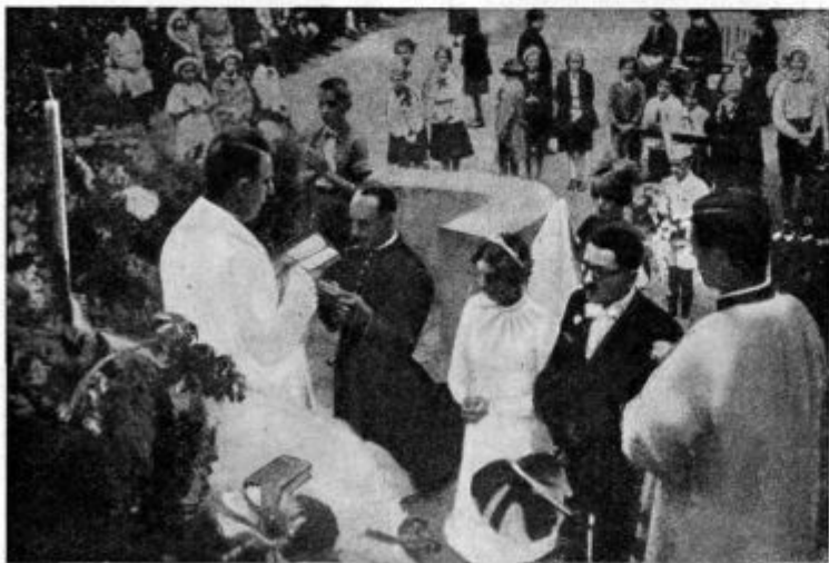
Poroka iz krogov kongreganistov v luški vollini v Segedinu. (Glej notico »K našim slikam«.)

Kako je — na žalost — dandanes otopela krščanska vest, krščanski moralni čut! Vedno manj se ljudje zavedajo, da je to in ono greh, da se je greha in grešne prilike treba ogibati, da se je treba zoper vse grešno boriti,