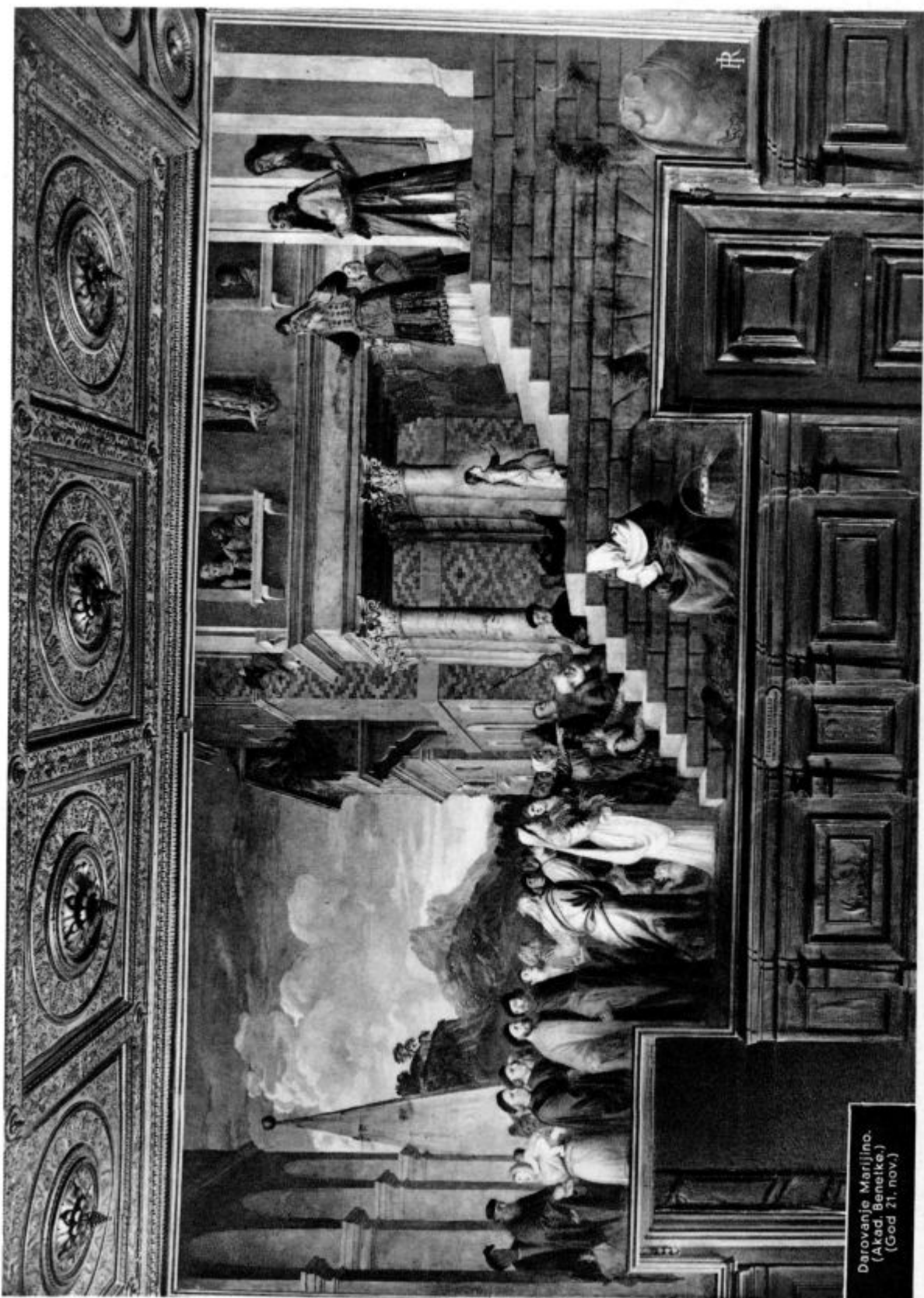
Darovanje Marijino. (Akad. Benetke.) (Grod 21. nov.)