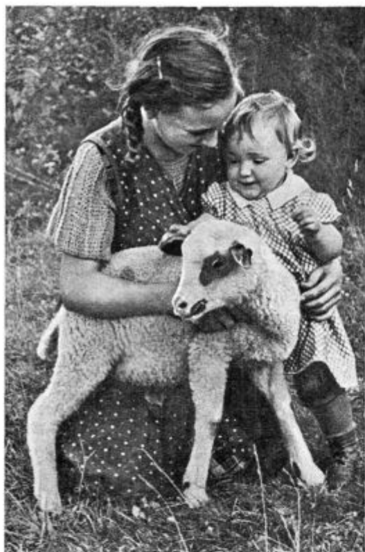
Trije, ki ne čutijo vojske.

brez maše nihče ne more Boga dovolj počastiti, nihče se mu ne more dovolj dostojno zahvaliti ali mu zadoščevati, in nihče ne more brez Jezusa prav prositi. Pri sv. maši je Jezus sam, ki prosí in se zahvaljuje v našem imenu,