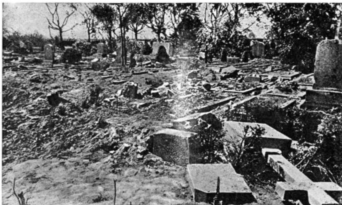
Vojska še svetim krajem ne prizanaša. (Prizor razdrtega pokopališča na zapadu.)

da krščanstvo zapoveduje gojiti čednost, ohraniti poštenost in čistost srca, varovati javno spodobnost in moralo. Od vsega krščanstva je današnja človeška družba v najboljšem primeru ohranila samo še neko zunanjo laično ali družabno dostojnost ali oliko, etiketo, ne pozna pa več pojmov greha, krivde in odgovornosti pred Bogom, kesanja in zadoščenja, spokornosti, poboljšanja, čednosti, srčne plemenitosti, pravičnosti, nadnaravne ljubezni in požrtvovalnosti za Boga in bližnjega. Pozabljene in neverjetne pravljice!