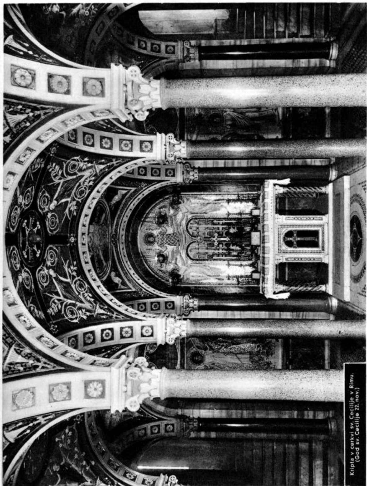
Kripta v cerkvi sv. Cecilije v Rimu. (God sv. Cecilije 22. nov.)