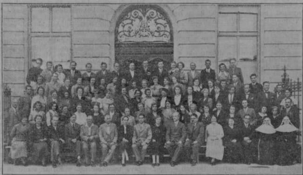
Udeleženci II. počitniškega pedagoškega tečaja P. C.

Najdelavnejša pedagoška ustanova pri nas je brezdvomno Pedagoška Centrala v Mariboru. Ustanovljena 1. 1921., je doslej privedla že štiri zelo uspele tečaje, razven tega pa prireja vsako leto več roditeljskih sestankov in o Veliki noči še posebna predavanja za starše. S svojimi predavatelji, ki jih smemo šteti med priznane pedagoge, zainteresira z vzgojnimi vprašanji tudi druge ustanove, kakor Ljudsko univerzo, prireja ekskurzije v inozemstvo ter pošilja tjakaj na mednarodne kongrese in na krajša študijska potovanja svoje za to zmožne člane. Središče njenega delovanja pa je v njeni, vedno bogatejši, knjižnici, ki se je more poslužiti vsakdo, kdor s skromno članarino 12 Din letno, postane njen član. Zal le, da je ukinjena poštinska prostost, ki je otežkočila izposojanje knjig posebno onim šolam, ki so zelo oddaljene od Maribora. Pri tej priliki je treba poudariti, da so meščanskošolski učitelji, včlanjeni v svojem društvu, korporativno pristopili, okoli 600 po številu, k Pedagoški Centrali in točno plačujejo svoje prispevke. Vseh članov je nad 1200.