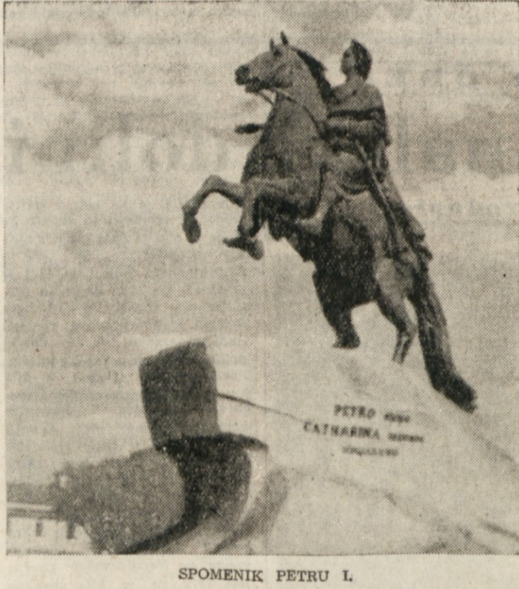
SPOMENIK PETRU I.

«Vi boste jedli», je rekel, «pa na vodo pazite in mi povejte, ko bo zavrela.» Nesmiselno je bilo, da bi se vsiljeval. Veasih je bilo treba celo vrsto služabnikov za kuhanje kaše. Toda meni je bilo silno nerodno sedeti s prekrizanimi rokami. Iz vreče je vsul nekaj prepečenca in drobtin. «To je namesto kruha», je rekel. «Upam, da nimate uhnetih zob.» Prišel ga je lomiti. Videl sem, da je bil trši od kamna. «Zmrznil je», je rekel. «Sicer pa imam prepečenec rajši od mrazlega kruha.» Nisem se razumel v te potankosti. Medtem je voda že zavrela. Razdrobil sem koncentrat in ga vsipal v kotliček. Voda je vrela, postala je motna in kaša se je pričela počasi dvigati. «Treba je potrpeti petnajst minut», je rekel. «Ali ste zelo lačni?» Rekel sem mu, da se.