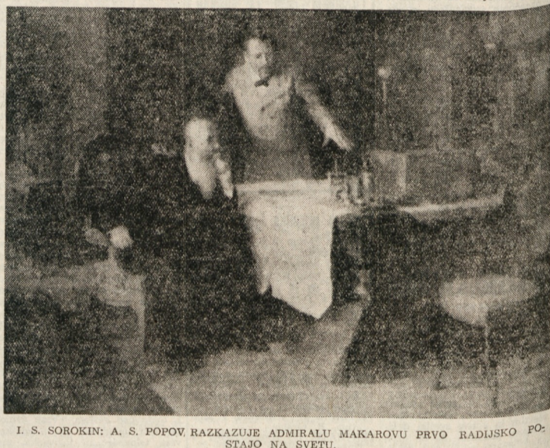
I. S. SOROKIN; A. S. POPOV RAZKAZUJE ADMIRALU MAKAROVU PRVO RADJSKO POŠTAJO NA SVETU.

Popov je bil med prvimi ruski fiziki, ki so študirali elektromagnetna nihanja. Njegovi poskusi so mu omogočili napraviti načrt za regulator atmosferske elektrike; to je napravila, ki predstavlja prototip vseh sprejemnikov tipa na iskro. Spomladi l. 1895 je Popov na seji ruske fizikalno-kemijske družbe na petrograjski univerzi pokazal prednosti svojega regulatorja atmosferske elek-