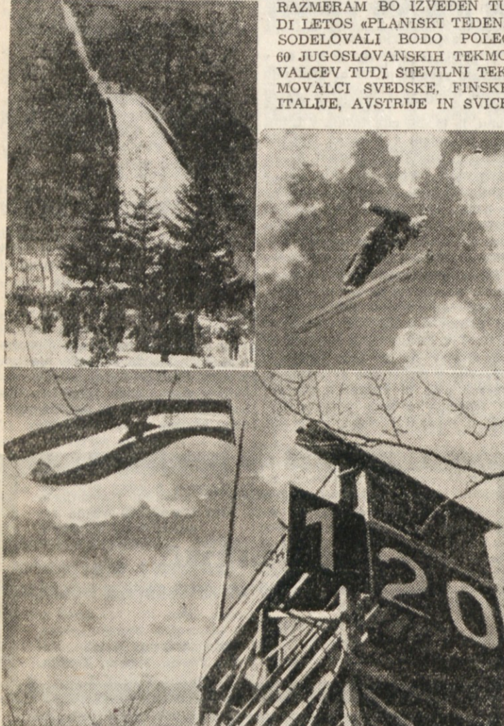
TEKMOVANJA SE BODO PRICELA V NEDELJO 20. MARCA TER BODO TRAJALA VES TEDEN DO 27. MARCA.

KLJUB SLABIM SNEZNIH RAZMERAH BO IZVEDEN TUDI LETOS «PLANISKI TEDEN». SODELOVALI BODO POLEG 60 JUGOSLOVANSKIH TEKMOVALCEV TUDI STEVILNI TEKMOVALCI SVEDSKE, FINSKE, ITALIJE, AVSTRIJE IN SVICE.