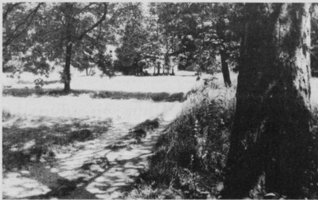
Čari turniškega parka.