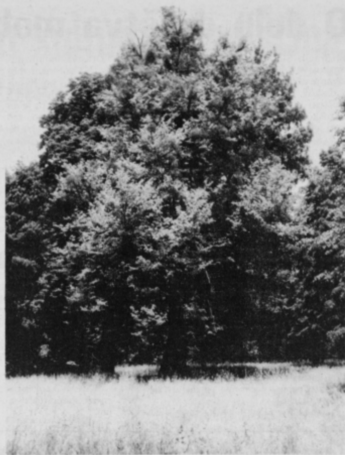
Skrbna roka bi marsikateremu drevesu podaljšala življenje.

Turniški park ni zaščen samo z občinskimi odlokom, temveč tu-