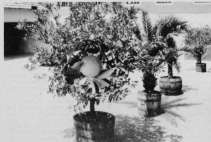
Drvo, obloženo z južnimi sadeži.