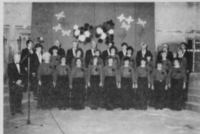
Mešani pevski zbor DPD Svoboda iz Ormoža veliko obeta.