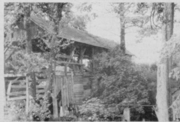
. . . žaga pa še vedno žaga.