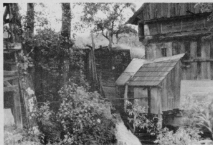
Mlin na mlinščici Sejanca še vedno melje . . .