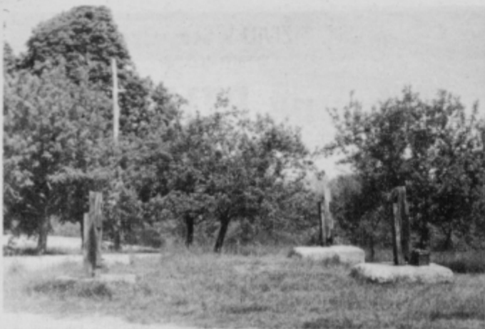
Na mestu, kjer je stal razgledni stolp, štrlijo v zrak samo še štirje stebri.